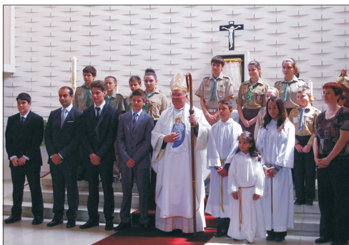
Cserháti püspök a montreali bérmlálkozókkal