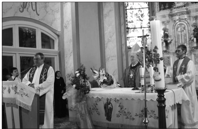
Szent György-búcsú Ungváron

Kárpátalján, Ukrajna nyugati régiójában egymillió-kétszáz-ezer ember él. A lakosság összetétele igen vegyes: ukrán, orosz, ruszin, szlovák, lengyel, német nemzetiségiek mellett mintegy százötven-százhatvan-ezer magyar él itt. Egész Ukrajnában tizenegy római katolikus egyházmegye van, a munkácsi az egyetlen magyar püspökség. (Veszprémi Főegyházmege)