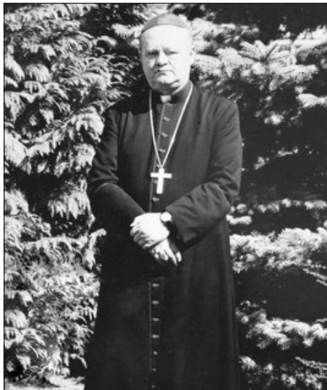
Ragaszkodása Egyházához példaértékű

Az 1990 utáni évek sikertörténetei közé sorolhatjuk az egyházmegyei karitászhálózat kiépítését. Orvosi rendelők, idősgondozók, családtámogató szolgálatok,