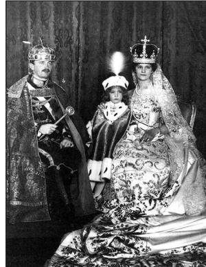
IV. Károly és Zita királyné 1916-ban, a koronázás után a 4 éves Ottóval

ba, majd később Madeirára száműzték férjével és gyermekeivel. 1921-ben elkísérte Károly királyt második magyarországi visszatérési kísérlete során (restaurációs kísérletek). Az utolsó magyar ki-