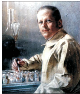
Boldog Batthyány-Strattmann László (1870–1931)