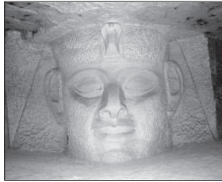
Ramszesz fáraó arcképe a barlangban

Hollandia jobbra protestáns ország, csupán a délkeleti csücskében fekvő Maastricht város térségét lakják zömében katolikusok. Maastrichtban jó 150 évvel ezelőtt a jezsuita rend teológiai egyetemet alapított, amely a mai napig működik. A tanulást kezdetül fogva szerdánként kirándulás szaktitka meg. Kezdetben a diákok a városközponttól délre