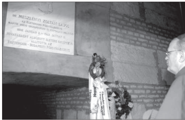
Erdő Péter bíboros Meszlényi Zoltán segédpüspök sírjánál imádkozik

Az eretnekség bűncselekményével pedig végepp nem vádolható. Ahhoz ugyanis még az sem elegendő, hogy valaki az Egyház lényeges hitigazságaival ellenkező nézetet szóban vagy írásban képviseljen. Ezt méghozzá a szó szoros értelmében kellene tennie, bizonyítható formában, hiszen a bűntető törvényeket szoros értelemben kell magyarázni. Tehát egy félreérthető állítást még tartalmilag sem tekinthetünk eretnekségnek. A