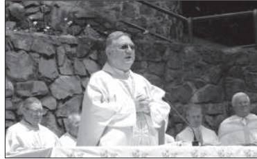
Tomaš Galis püspök az imanapon

az Egyház iránti megbecsülést egész Európában. Imádságunk forduljon Istenhez, minden nép Atyjához és az ő Édesanyjához, hogy állhatatosak legyünk a békéért, az egyetértésben, a tiszteletben, és hogy az egység felé vezessen bennünket, hogy Isten valódi családja lehessünk”.