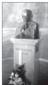
szertartás szerint Mindszenty bíboros egyetlen elődje sem végzett annyi főpapi szertar-

tást a Szent István-bazilikában, mint ő. „A negyvenes évek vége felé én is ott szorongtam egy alkalommal a bazilikában, amikor a hercepprímás beszélt. (...) Megemletem egyik lábomat, hogy kissé jobban helyezkedjem a minden oldalról nyomó tömegben, s a beszéd végéig nem tudtam többé visszaállni helyemre: kénytelen voltam egy lábom maradni végig. Szó szerint minden talpalmatnyi hely el volt foglalva” – írja.