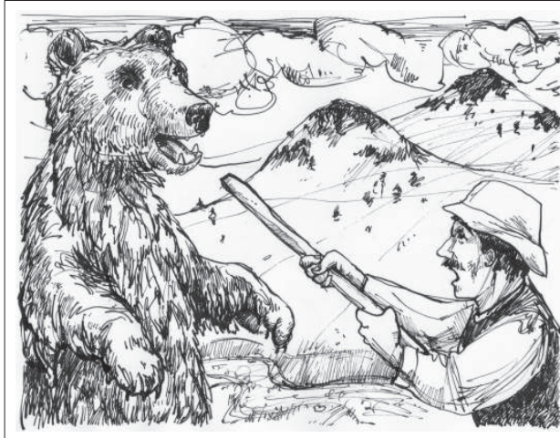
Nagy Boglárka rajza

Így tréfálkoztak a medve fölött, majd megszüntették a tüzet, s lassanként elaludtak. A csillagok még tündököltek egy ideig, aztán dél felől meleg fuvalom keletkezett, s felhőket hajtott a csillagok elé. Hajnalban már erősen gomolygott a