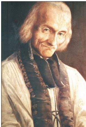
Vianney Szent János a papok védőszentje (1786. május 8.–1859. augusztus 4.)