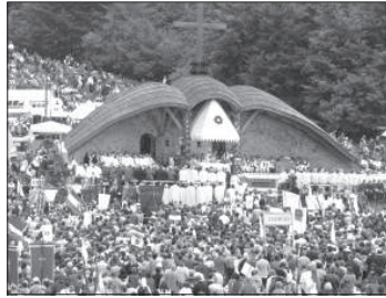
A két Somlyó-hegy közötti Nyerget ismét megtöltötték a zarándokok

Isten nem lehet nagylelkűségben felülmúlni. Ő a lelki erősség adományát is ne-