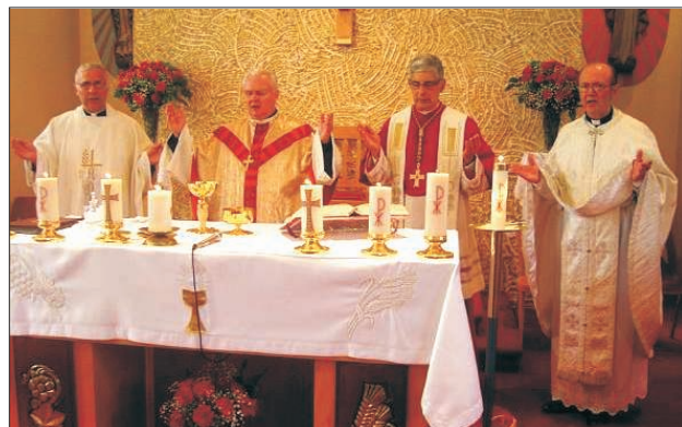
Az első szentmise a hamiltoni Szent Ferenc-templomban