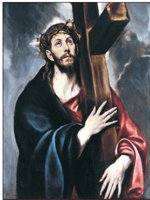
El Greco (1541–1614): Krisztus a kereszten (Metropolitan Museum of Art, New York)