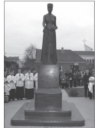
A Szatmárnémetiben újonnan felavatott Szent Erzsébet-szobor