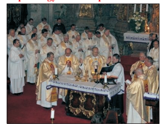
Szentmise az Egyetemi templomban

Erdő Péter bíboros szentbeszédének első részében a rend alapítását és az alapí-