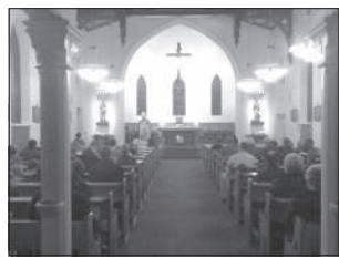
Ünnepi szentmise a helsinki Szent Henrik-templomban

tartozik, hívó meggyőződése szerint él, és ez a következetesen vállalt meggyőződés szembeállíthatja őt a környezetével.