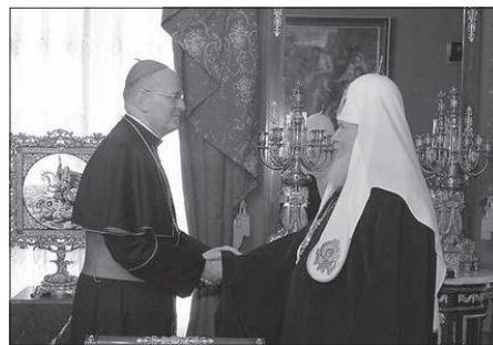
II. Alekszij pátriárka 2007 júniusában fogadta Erdő Péter bíborost, aki az Orosz Ortodox Egyháznak ajándékozta Szent István király ereklyéjének egy részét

December 9-én az Egyház és a politika magas rangú képviselőinek jelenlétében megtették el II. Alekszij pátriárkát. Több mint 80 000 ember tette tiszteletét a moszkvai Megváltó Krisztus-székesegyházban felavatott egyházfő előtt.