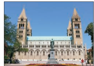
A pécsi székesegyház

Az ideai Pécsi Advent rendezvénysorozata szintén ezt tüzte ki célul a különböző