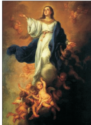
Szűz Mária mennybemenetele Bartolomé Esteban Murillo (1617–1682)