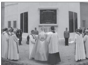
Az emlékművet Erdő Péter bíboros áldotta meg

Plébániánk régóta tervezi, hogy erre az évfordulóra az 1956-os forradalom és szabadságharc áldozatainak emlékművet állíttson. Józsefváros Önkormányzata kezdetétől fogva folyamatosan támogatta