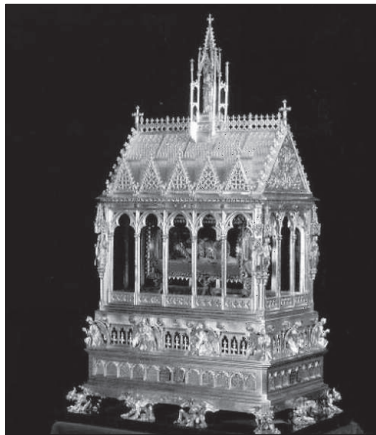
A Szent Jobbot hazatérte után, Scitovszky hercegprímás kezdeményezésére helyezték el a jelenlegi ereklyetartóba