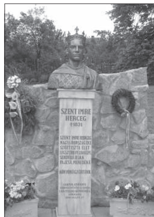
Szent Imre szobra Hegyközszentimrén (Lantos Györgyi alkotása)