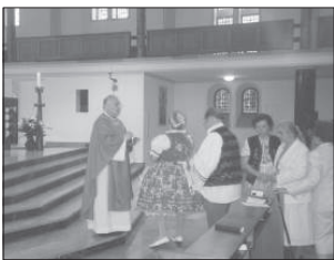
A püspöki szentmisén

A szentmise után a Mária-Trost öregotthon ünnepélyes termében közös ebéd