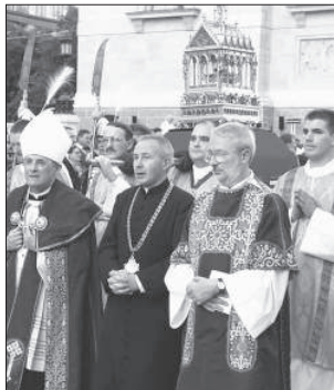
A II. világháború előtt a körmenet nem a pesti Ferences templomtól a Bazilikáig tartott, hanem a Budavári Palota Udvari Várplébániájától a Nagybaldogasszony-templomig

1990 óta augusztus 20. ismét Szent István ünnepe Magyarországon. Budapest a legfontosabb események a Bazilika körül zajlanak. Innen indul a Szent Jobb-körmenet is: elől István király jobb kezének ereklyéje, mögötte pedig keresztények és nem keresztények ezrei a Szent István tér – Zrínyi utca – Október 6. utca – József Attila utca – Nádor utca – Október 6. utca – Zrínyi utca – Szent István tér útvonalon.