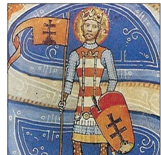
Középkori Szent István-ábrázolás

Jack London egyik novellája hajósokról szól, akik erejüket megfeszítve kelnek át a Horn-fok sok hajót elnyelő, rettenetesen viharos tengerén. A tapasztalt kapitány már ismerte a mondást. És elhangzott a parancs a kormányshoz: „Tarts nyugatnak!” Nekünk azért jelent sokat az idézett novella címe, mert a magyarság ősidők óta ezzel a törekvéssel kereste hazáját: „Tarts nyugatnak!” Az első nyugat felé vándorlásunk, ameddig a szem visszafelé ellát, az Urál hegységben való átkelés volt, talán a Kr.u. 4. században. Erre a szintén nyugat felé terjeszkedő hunok nyomása a legelfogadhatóbb megokolás. A mai Baskíria térségében találják meg történezeink a régi-régi Magna Hungariát, ásatásokkal is megerősítve. De akkor már az Urál keleti térségéből, Délnyugat-Szibériából hoz-