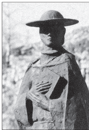
A Pécsért található Janus Pannonius (1434-1472) -szobor – Borsos Miklós alkotása

A Pécsi Egyházmegye október 22-én újratemeti Janus Pannoniust, a nagy humanista költőt, akinek hamvait 1991-ben, a székesegyház fűtésrendszerének korszerűsítéséhez kapcsolódó ását alkalmával találták meg. A közelmúltban elkészült antropológiai vizsgálatok egyértelművé tették, hogy az ását alkalmával valóban Janus Pannonius földi maradványaira bukkantak. A munkálatok során nyolc középkori sír került elő, amelyek közül az egyik nagyjából a földtár alatti helyezkedett el. Ez a hely századokon keresztül a legmagasabb rangú egyházi személyiségeket illette meg, márpedig a korabeli feljegyzések szerint Janus Pannoniust pontosan ide temették.