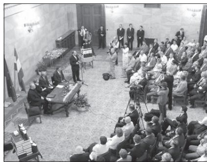
A parlamenti képviselők az Országgház Delegációs termében vehették át a Bibliákat