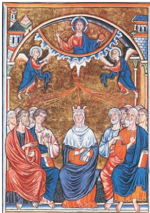
A Szentlélek eljövetele (Miniatúr, XII. sz. – Musée Condé, Chantilly)