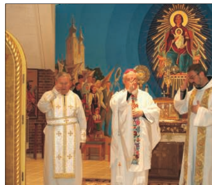
A New Jersey állambeli Matawanban, a görög katolikus bazilita atyák Máriapócs-kegyhelyén