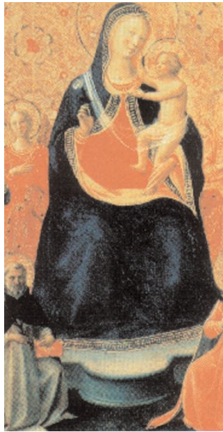
Fra Angelico: Madonna a gyermekkel, 1435 k.

tanítványa, így szólt anyjához: „Asszony, nézd, ő a te fiad!” Aztán a tanítványhoz fordult: „Nézd, ő a te anyád!” Attól az órától fogva házába fogadta őt a tanítvány.”