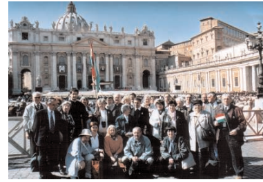
Stuttgarter magyarok a Szent Péter téren