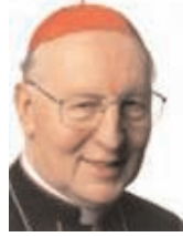
Friedrich Wetter bíboros

Február elején Münchenben ünnepei nagymise keretében emlékeztek meg Wetter bíboros 75. születésnapjáról. A szertartáson a bajor kormány Zehetmair művelődésügyi miniszter, a várost pedig Ude polgármester képviselte. Résztvett valamennyi bajor püspök, valamint Scheffczyk müncheni bíboros is. A begyült adományokat az „Akcio az életért” alapítványnak továbbították, amely várandós anyáknak segít, ha konfliktushelyzetbe kerülnek. Már ez a gesztus is jól példázza Wetter bíboros életművének egyik vetületét: mint Schick bambergi püspök az ünnepséget követő fogadáson mondta: melegsívűségével a bíboros sohasem téveszti szem elől a célt, mert nem a számítás, vagy a politika irányítja, hanem kizárólag istenhite. Mindezt megerősítette Zehetmair miniszter is, aki a bíborost egyházmegyéje első plébánosának nevezte, mert életvitelével is példát mutat híveinek.