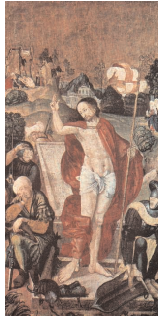
M.S. mester - csak így ismeri a művészet-történelem, Kolozsvári Tamás mellett régi festészetünk legnagyobb alakja. Feltámadás című fenti képe 1506-ból való. Esztergomi Keresztény Múzeum.

Ha el akarjuk mélyíteni anyanyelvünk húsvét szavának jelentését, akkor abba kell belegondolnunk, mi is ennek a konkrét üzenete. Annnyira nagy ünnep volt ez a Húsvét eleink számára, hogy