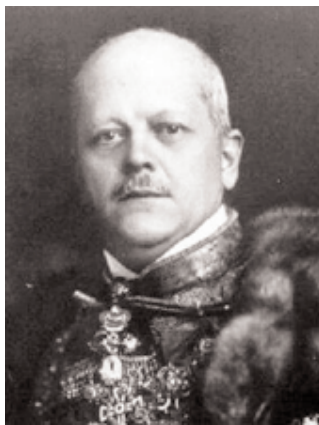
Batthyány-Strattmann László 1870-1931

A rendszerváltás utáni évek egyik visszatérő témája a múlttal való szembenézés. Ebből a szempontból nagyon fontos annak tudatosítása, hogy a magyar Egyház XX. századi történetében vannak