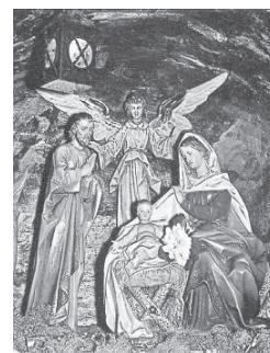
A Kiszűvés megszületett övendűnk!