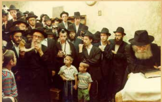
Sófárfújás a Rebbe imaszobájában

Bölcseink azon megállapítását, hogy „minden zsidó méltó arra, hogy a szukában ülhessen” kiterjeszthetjük arra a megállapításra, mely szerint egy kölcsönvett szukával is teljesíthető az előírás, mely során minden szu-