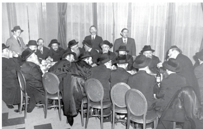
Haszid rebbék, köztük a csernobili rebbe, a zvil-mezebuzsi rebbe tisen, 1943-ban.

A Chábád hászidizmusban a tis helyett a szintén jiddis fárbrengen kifejezést használják, mivel ezeken nem osztanak sirájimot, és többnyire nem esznek, vagy nem hangsúlyos része az összejövetelnek az evés. A hetedik Rebbe, Menachem Mendel Schneerson rabbi ösztönzésére igen gyakran sort kerítenek rá, hogy inspirálják a résztvevők spirituális növekedését. Héberül a hitváádut szóval illetik az összejövetelt.