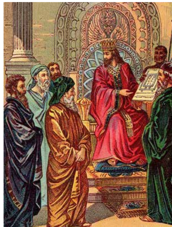
Salamon a templom terveivel

vének pontosan úgy fogalmaznak, ahogy Mózes ezt 300 évvel korábban előrevetíti: „Ha bemész az országba, melyet az Örökkévaló, a te Istened ad neked, és elfoglalod azt és laksz benne és azt mondod: Hadd tegyek fölém királyt, mint mind a népek, melyek körülöttem vannak; tehetsz magad fölé királyt;