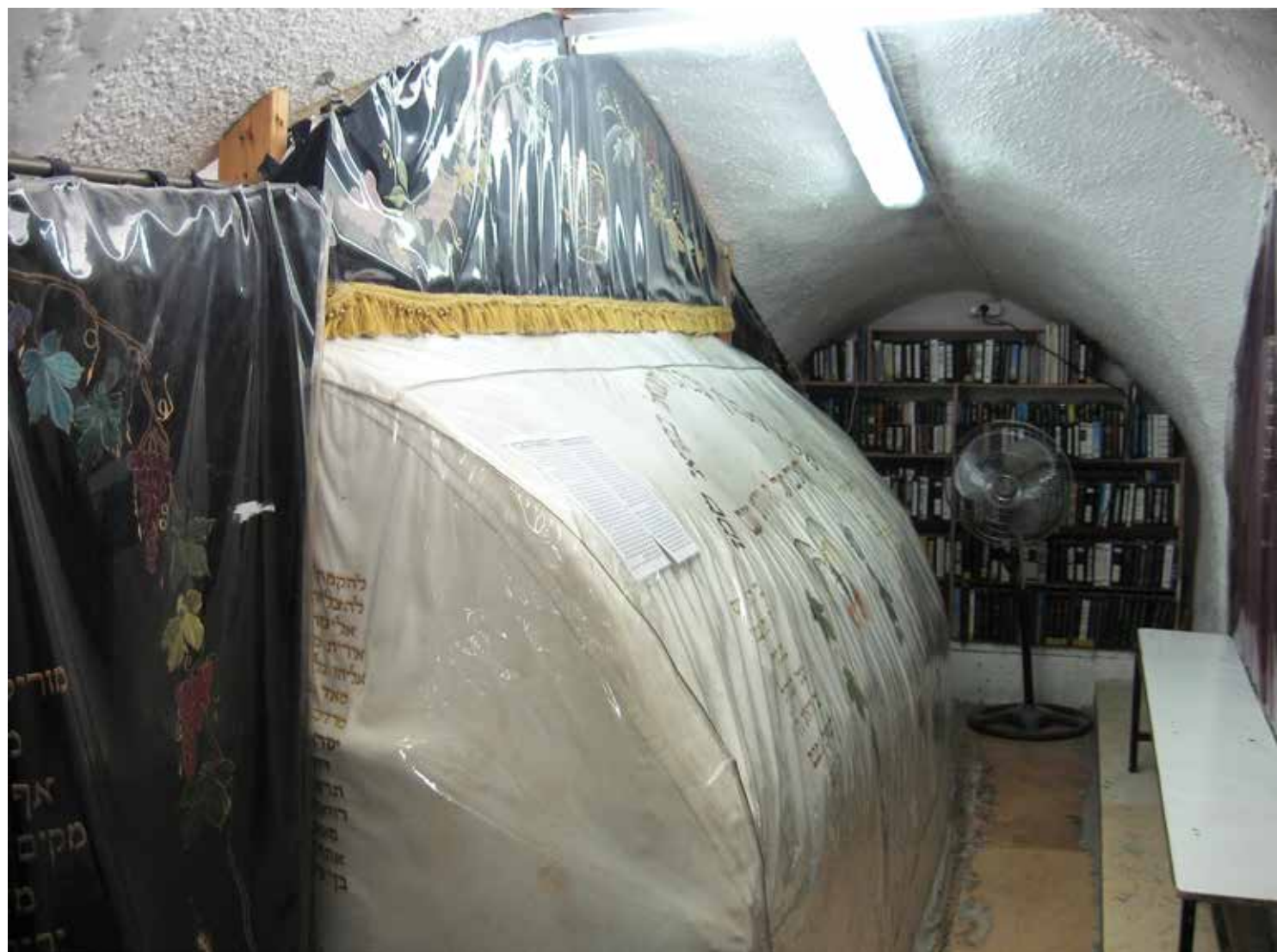
Sámuel próféta sírja

Az elmondottak alapján már csak egyetlen dologra kell választ találnunk. Arra, hogy miként lehet biztosítani, hogy ne kerüljön túl nagy hatalom egyetlen ember kezébe. Az