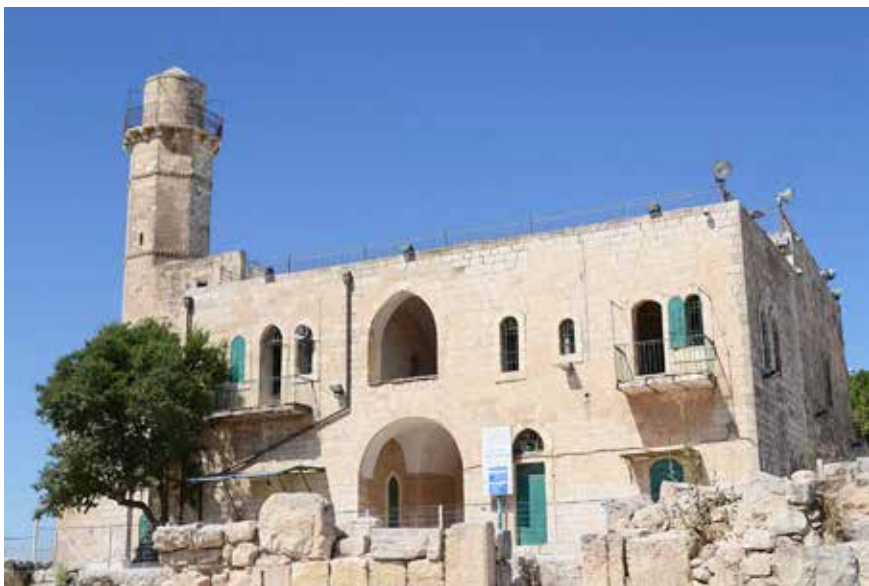
Sámuel próféta sírja kívülről

ókori Izraelben négy hatalmi ág létezett egymással párhuzamosan. A bíró vagy a király mellett a próféták, a papság és a jogalkotás, illetve a törvénykezés intézménye is jelen volt. E hatalmi ágak élesen elkülönültek egymástól. Természetesen az itt leírt modell egy ideális államról kíván képet adni, ami a Biblia tanúsága szerint nagyon rövid ideig működött így a gyakorlatban. A királyok, úgy tűnik, könnyen hajlottak arra, hogy gyorsan túl nagy hatalmat szerezzenek maguknak, és emiatt a rendszer egyensúlya is érthető módon hamar borult.