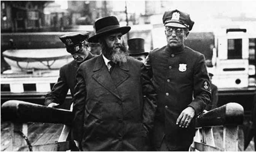
Josze Jichak Schneerson, a 6. lubavicsi Rebbe megérkezik Amerikába

Látogatása alatt egy újságírónak a következő nyilatkozatot adta, melyet a Zsidó Ujság is lehozott: