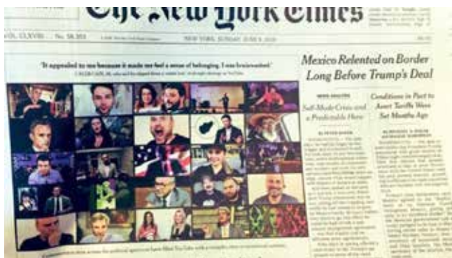
A képeken: Jordan B. Peterson, Milton Friedman, Ben Shapiro, Laura Southern és még sokan mások.

A The New York Times a botrány farvizén megjelentetett egy cikket, amelyben azt elemzi, hogy a néhány hete egy zsinagógára horogkeresztet graffitizó fiatal hogyan radikalizálta a YouTube. A szerző szerint olyan „radikális” emberek videói sodorták a szélsőjobb felé a férfit, mint az ortodox zsidó kommentátor Ben Shapiro, az említett Steve Crowder vagy a néhai liberális közgazdász, Milton Friedman.