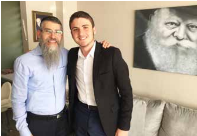
Benji példaképével, a híres chaszid énekessel, Avraham Frieddel

Rózsa-Groó Benjámín: Nagyon sok mindenben, kint a hangsúly inkább a tórai tanulmányokon van, jobban szeretem az egész rendszert, mint az itthonit, mert kint tényleg az a cél, hogy segítsenek felkészíteni az életre, ami iskola után vár ránk. De emellett sokkal több a stressz, és az érettségi ezerszer nehezebb, mint az itthoni és nem csak a nyelv miatt, ami már nem is az igazi akadály, amikor az ember eljut az érettségiig. Inkább az anyag mennyiségével és minőségével van a „probléma”: nagyon sok és nagyon magas szintű, ami