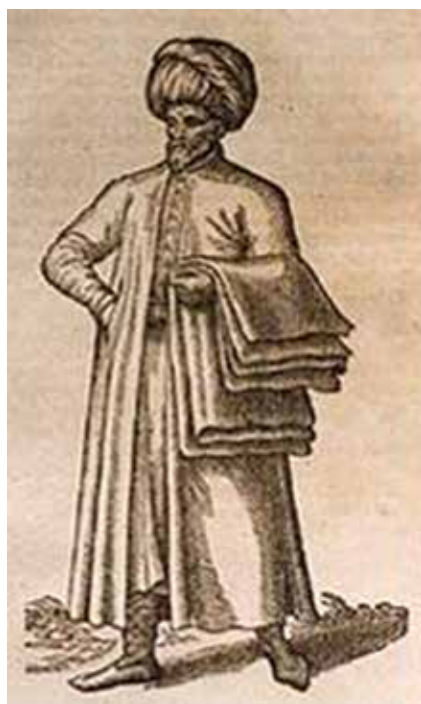
Don Isaac ben Júda Abarbanel

A 15. század második felében – több, a zsidó tudományokban szintén kiemelkedő kortársával egyidőben – élt egy igazi reneszánsz ember, Don Isaac ben Júda Abarbanel (1437–1508). Abarbanel, amellet, hogy a teljes Zsidó Bibliához írt erőteljesen fi-