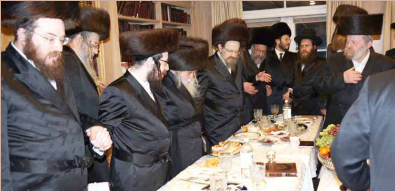
A csernobili rebbe Los Angelesben

Az utóbbi időben egyre több csoport veszi a bátorságot, hogy felkeressék a sírt és a zsinagógát, elsősorban szkveri hászidok. „ Elutazunk Csernobilba, mécseseket