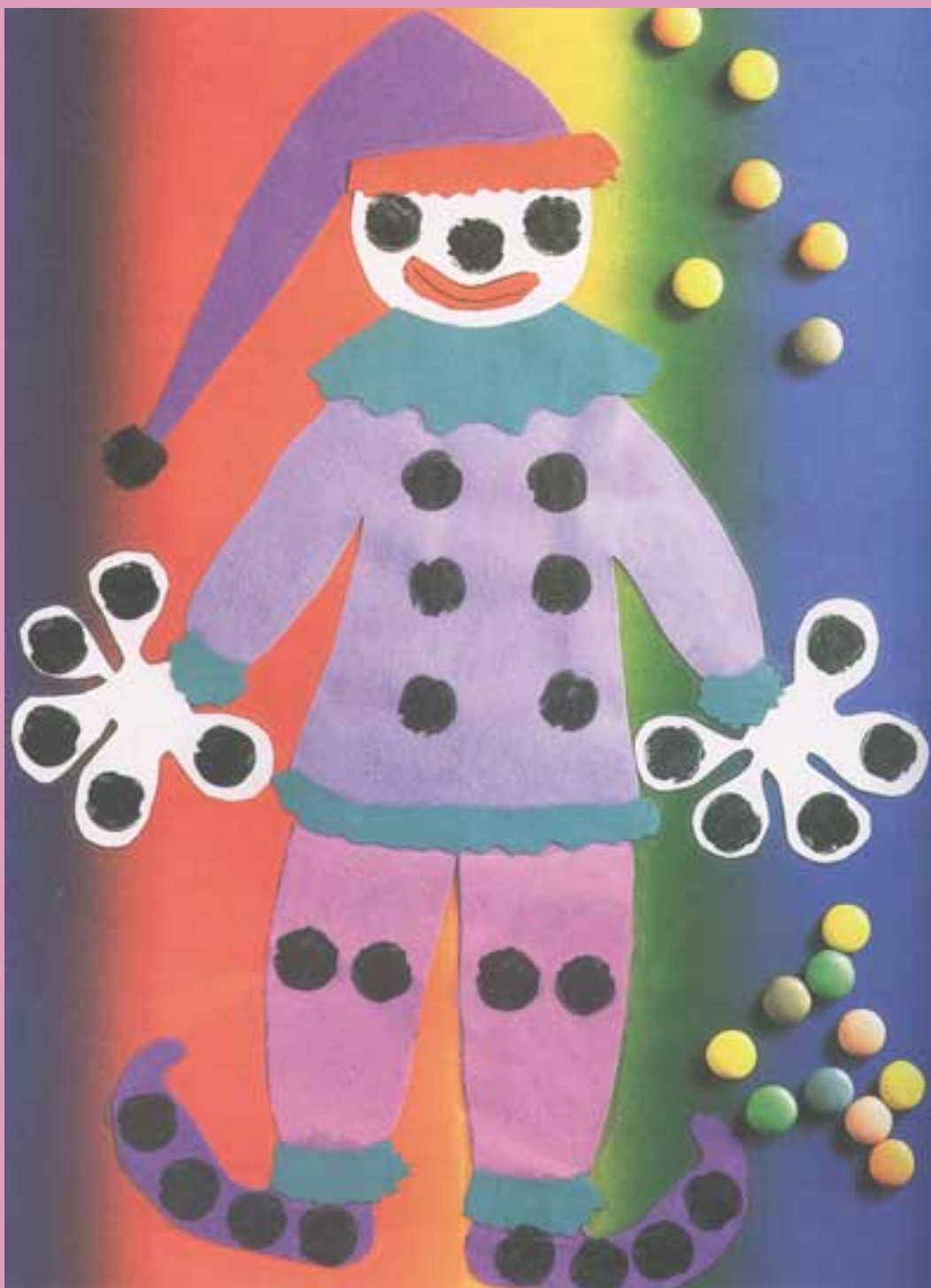
A Magyar Könyvklub Új barkácskönyv gyerekeknek c. könyve nyomán