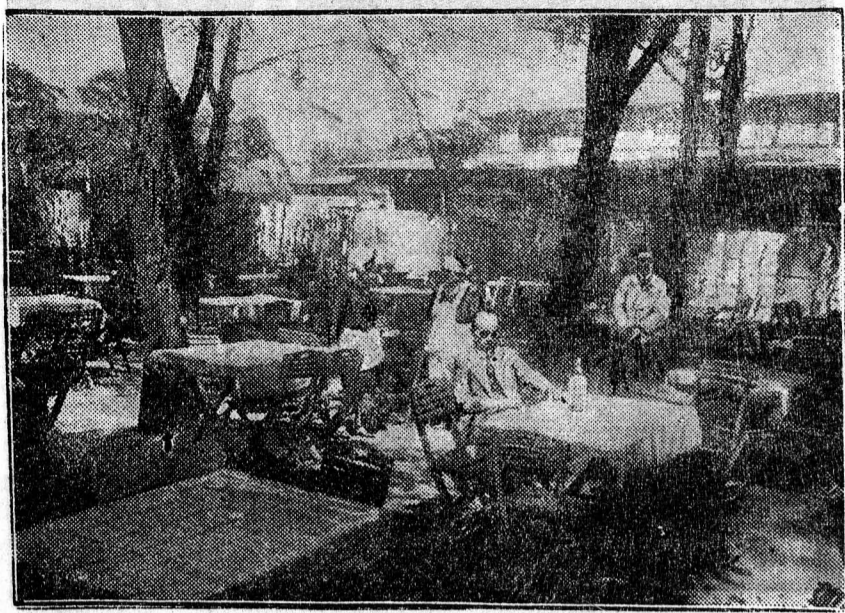
Vasárnap délután hatkor kezdődött Pesten a szesztilalom