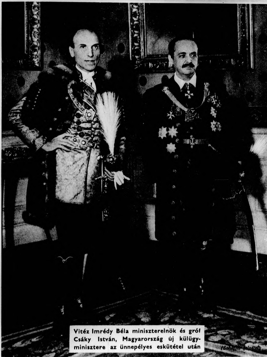
Vitéz Imrédy Béla miniszterelnök és gróf Csáky István, Magyarország új külügy-minisztere az ünnepélyes eskütétel után