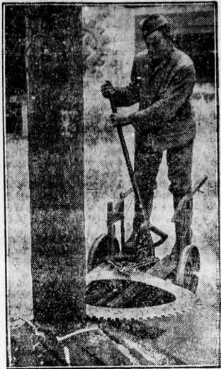
Ujfajta favágógép, amely négy perc alatt kivág egy félméter vastag fát

Egyelőre azonban nem szólok senkinek erről a fantasztikus felfedezés-