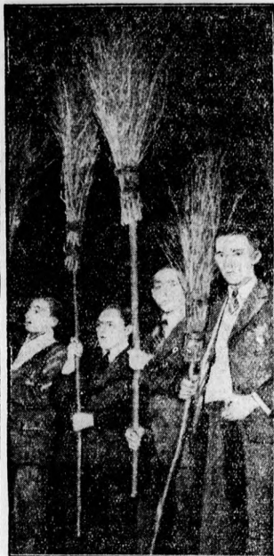
A belga fascista jelvénye: a seprő, amellyel azt kívánja kifejezésre juttatni a párt, hogy ki kell seprni az állami életből az odanemavaló elemeket