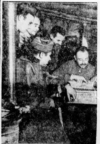
Ismerős kép: földalatti fedezék a spanyol fronton

s azt tapasztalja, hogy az iskolai oktatással és hosszabb tanfolyamokkal szemben előnyösebb a rövidebb előadás-sorozatokkal dolgozó szakmiretterjesztési módszer mert kizárólag csak azt a szűkebb tárgykört kell ismertetni, ami az adott helyen és esetben a gazdákat közvetlenebb érdeklí s így sokkal gazdaságosabban s a hallgatóságra eredményesebben lehet az egyes kérdéseket az irántuk érdeklődő gazdáltereknek tudomásra hozni.