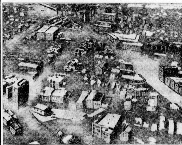
Kép az amerikai árvizkatasztrófáról Louisville város az Ohio-folyónál

Az igazi megbékélés előfeltételül megjelölt körülmények közt a fontosabb Hitlernek a Népszövetség átalakítására, a teljes egyenlőség elismerésére és a fegyverkezés kérdésének egyetemes keretben való kezelésére vonatkozó kijelentését. Végül bejelentette, hogy a jövő feladata az új alkotmány kiépítése. A spanyol nemzeti csapatok főparancsnokának hadijelentése szerint a nemzetiek az aragóniai fronton a rossz idő ellenére is tovább folytatták előretolt állásaik megerősítését.