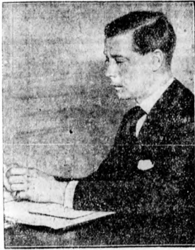
Edward, Windsor hercege, aki trónját feladta szerelmért

Windsor hercege, a lemondott angol király december 13-án éjjel Bécsbe érkezett. Az osztrák főváros közelében lévő enzersfeldi kastélyban fog tartózkodni, amely a Rothschild-család tulajdona. Hír szerint néhány hónap múlva nőül fogja venni Simpson asszonyt.