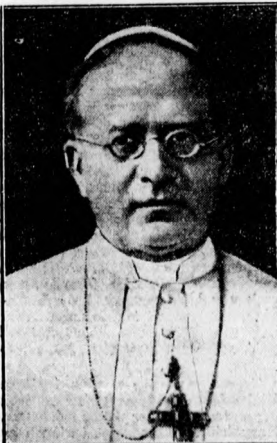
XI. Pius pápa. Akinnek boldogságú agróló létekelé kísérel a világ. A legutolsó hírek szerint állapota örvendétesen javult.

Reméljük, hogy a kormány megla-lálja azt a helyes megoldást, amely jogfosztás nélkül is öszegyezteti a választójog reformját a nemzet maga-sabb érdekeivel. (K. M.)