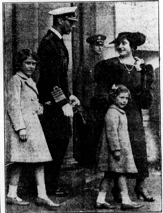
VI. György, a negyvenegy éves új angol király; Erzsébet királynő és két leánygyermekük. A nagyobbik az angol trón örököse.

Testvéri lélekkel figyeljük a magyarországnak azt a harcát is a Dunamedencében, hogy újra