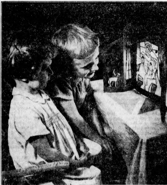
A kis Jézus a jászolban . . .