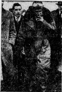
Az első cigareta a világekorán... A hírneves angol repülő: James Mollison. 13 óra és 13 perc alatt repült át az Atlanti Óceánt. Ót óraval verte le az eddigit rekordot