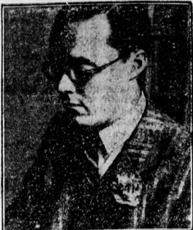
Bernhard német herceg, a holland trónörököső vőlegénye

Filmes vasárnapok. Az Államvasu- túk igazgatósága közül, hogy szeptem- ber 20-án következzen filmes és ünnep- vonatokat indítja: 1. Budapestről Gyű- nyőre. A menettéri jegy ára 2.40 P. 2. Budapest Déli pályaudvartól Pécsre. A menettéri jegy ára 5.— P. 3. Budapest- ről Budaörsre. A menettéri jegy ára 4.20 P. 4. Zalaegerszegről Balatonfűrd- re (Tapolcán). A menettéri jegy ára 2.00 P. 5. Sopron és Szombathelyről Ba- latonfűrdre. A menettéri jegy ára Sop- ronnál 4.50, Szombathelyről 3.50 P. 6. Salgótarjánból Budapest Keleti pályau- dvárra. A menettéri jegy ára 3.10 P. 7. Törökszentmiklósról Egerbe. A me- nettéri jegy ára 3.50 P. 8. Kétnapos tu- risztaságok. Kétszere. A hazai tu- risztaságokkelt rendezésében szeptem- ber 10-én, 20-án rendkívüli kedvezményű turista-gyrosvonatot indítanak Kétszere. A menettéri jegy ára 3.70 pengő.