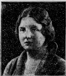
Juliana holland trónörököső, aki Bernhard német herceggel eljegyezte magát

Gömbös Gyula miniszterelnök a pécsei egyetem disztkozta. A Kormá- nyzó megengedte, hogy a pécsei magyar királyi Erzsébet Tudományegyetem Tanácsa vitéz jék- fán Gömbös Gyula magyar ki- rályi miniszterelnököt a magyar nemzet érdekében nehéz időkben vég- zett munkássága, valamint a közelet terén szerzett kiváló érdemei elismer- éséről a bölcsészettudományok tiszte- letbeli doktoriává felavathassa és rú- szere a tiszteletbeli doktori oklevélt kiszolgáltatathassa.