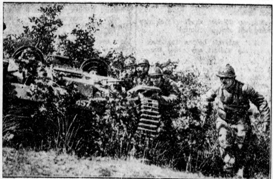
A modern hadviselésben a gyalogság a páncélosok védelme alatt nyomul előre