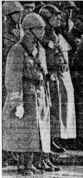
Viktor Emánuel olasz király, akit Abesszínja császárdíjával proklamáltak. Mellette áll Mussolini miniszterelnök.