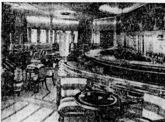
Kávéház az angol uszövővárosban, a „Queen Mary” fedélzetén

A magyar szövetkezeti élet valóban a puritán önszegély gondolata alapján épült fel. Hogy csak a hitelszövetkezeti mozgalmról beszéljünk, leszögezhetjük, hogy a közel 1000 hitelszövetkezet, mely központjai köztételekben működik, teljesen önéreje támaszkodik és sem állami szubvencióban, sem állami tőkehozzájárulásban nem részesül. Saját tőkéjüket a hitelszövetkezetek tagjajuktól szedik üzletretek és takarékbetétek formájában. Hogy