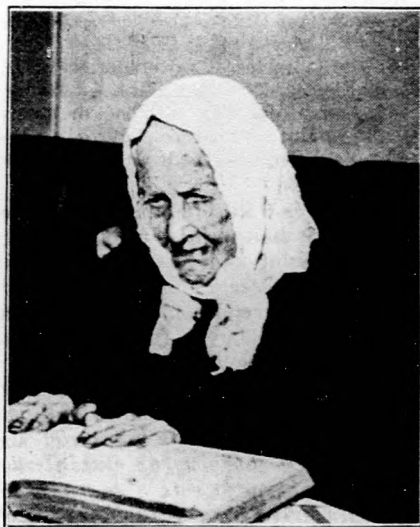
Egy százt esztendő s német asszony,