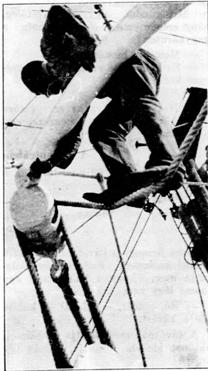
Nagytakarítás a hajón

Jó hangszerezen játszani a leg-nagyobb élvezet. Elsőrangut, igazán olcsón Reményi országos hírű hang-szertelepén vásárolhat: Budapest, VI./15., Király-utca 58—60. Kérjen díjmentes 51. számú árjegyzéket, ab-ból választhat.