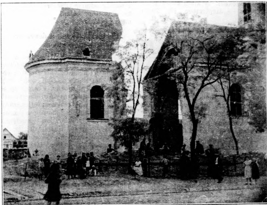
A kettévágott dunapataji templom

A következő kiállítási csoport lesz: a gyümölcs. Országunk kedvező fekvése és talajviszonyai nagy előnyt jelentenek és gyümölcsünk egyik-másikának minősége, ize, zamata szinte utolérhetetlen. Szeretik is külföldön a magyar gyümölcsöt, exportunk állandóan emelkedik. Terme-