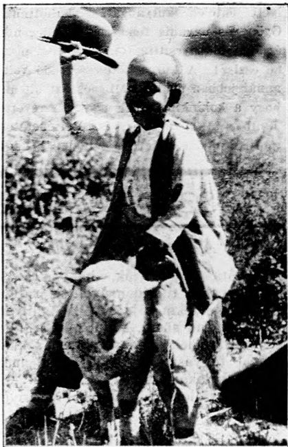
Fekete a fehéren