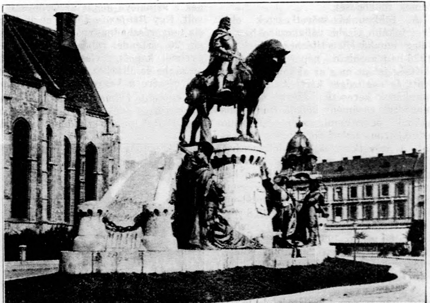
Kincses Kolozsvár: Mátyás király szobra

S ma oláh városoknak hirdetik őket. Kincses Kolozsvárt, a Mátyás király szülővárosát, ahol büszke éreszobra ma is áll, a régi Erdély fővárosát, a Rákócziak, Bethlen Gáborok, Báthoriak, Bocskaiak, Telekiek ősi fészket. Vagy Aradot, a tizenhárom vértanu szent és feledhetetlen Golgotáját. Temesvárt, a törökverő Hunyadi büszke örökét. A