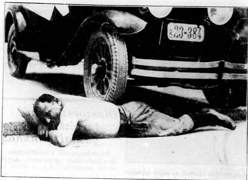
Görögország legerősebb embere

Ez az ötvenesztendős görög nyugodtan elviseli, hogy egy autó keresztülmenjen a hátán.