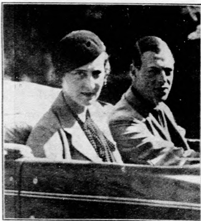
György angol herceg és Marina görög hercegnő jegyesek Az angol király harmadik fia eljegyezte Marina görög hercegnőt.

A Társadalmi Egyesületek Szövetsége a Nemzeti Munkahéten impozáns keretben mutatja be a magyar ipar teremtő erejének szemléltető bizonyítékát hatalmas, látványos ipari felvonulás keretében. A felvonulásban résztvesznek ugyancsak az összes nagy vállalatok feldiszipített járművei. Szeptember 30-án, a Kormányzó Ur Budapestre történt bevonulásának jubileumi ünnepségén és a Nemzeti Munkahét megnyitóján ipari és kereskedelmi díszmenet vonul el a Kormányzó Ur páholya előtt és bemutatja a magyar ipar munkájának nagyszerű eredményeit. Az ünnepség lezajlása után a több kilométer hosszúságú kocsimenet végigkigyózik a fővárosban. A Nemzeti Munkahét többi napján pedig reklámfelvonulás keretében vonulnak végig a főváros utcáin a feldiszipített járművek.