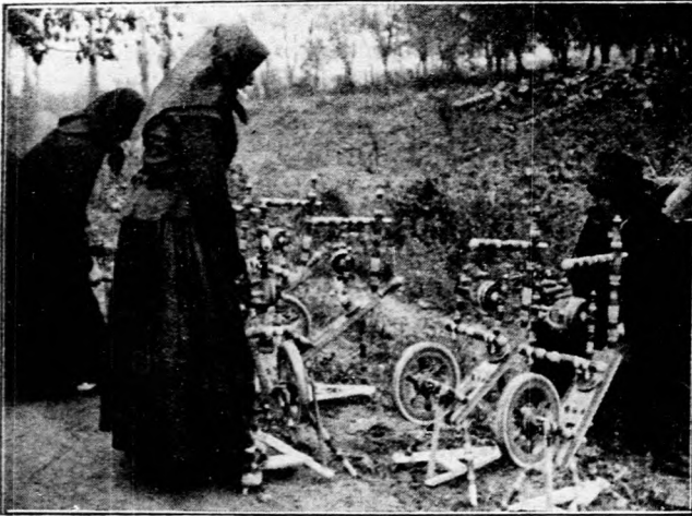
Rokkavásár a baranyai Szent István községben.