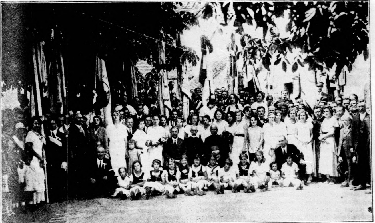
Kép a devecseri római katolikus legényegylet huszonöt eszten dős jubileumi ünnepségéről.