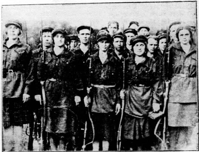
A „leszerelés” hirdető Szovjetországnak még a nőket is kiképzí katonai szolgálatra.