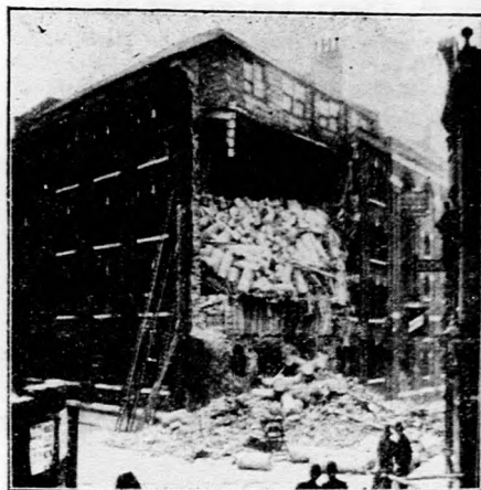
Beomlott áruház a londoni utcán.