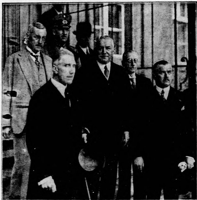
Az új német kormány.

Balról: Papen alezredes, birodalmi kancellár, mellette Neurath külügyminiszter, volt londoni német követ.