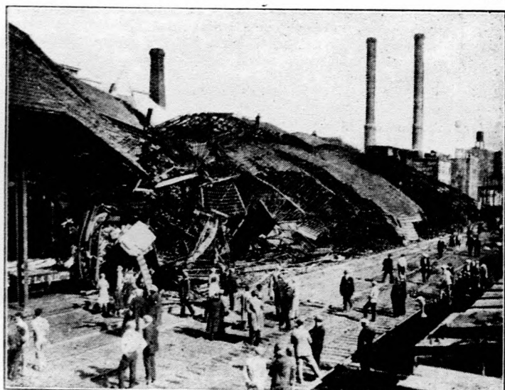
Szélvihar elpusztított egy pályaudvart Délamerikában.

„Anyák napja” Magyarországon. Külföldön már régebben meghonosodott az a szokás, hogy május hó második vasárnapját az édesanyák tiszteletének szentelik. Most nálunk is mozgalom indult az Anyák napja megvalósítására. Március hó 2-án Budapesten megalakult az „Anyák napja” nagybizottsága, amely elhatározta, hogy már ebben az évben előkészíti május második vasárnapjának országos megünneplését.