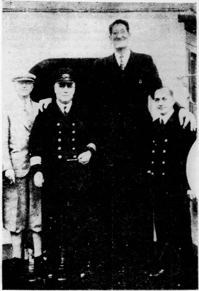
Egy 2 méter 69 cm. magas amerikai óriás.

Nyugalmad akkor lesz igazi és boldog, Majd ha nagy hazában porlad hősi csontod! Áldjon meg az Isten! Tőled így búcsuzik A frontharcos tábor: „A viszontlátásig!”