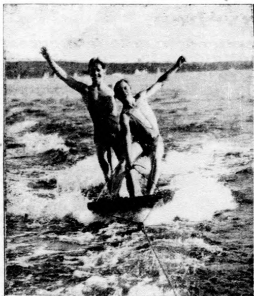
Nyári örömök januárban a föld — déli oldalán.

Február hó 7-én nagy érdeklődés mellett folyt le az ercsi fiókszövetség gyűlése, amelynek tárgysorozatára a vagyonváltásföldék kérdése volt kitűzve. Ercsi község földhözjutottaitól a holdanként átlag 60 pengőt kitevő törlesztést a 4-5 mázsás termésekből teljesíteni nem tudják. Emiatt mintegy 500 hold juttat-