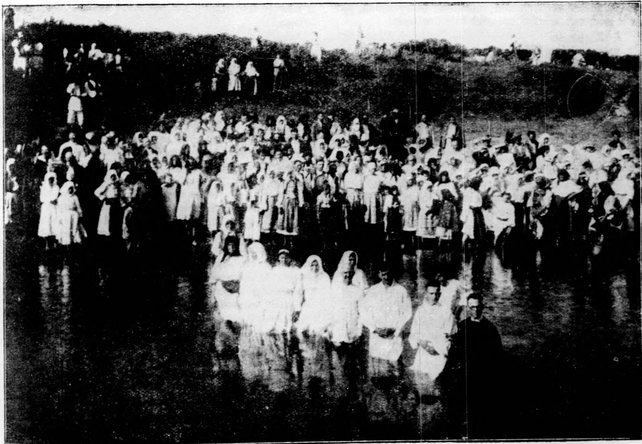
Baptista keresztelő a folyóvízben.

mett jó kenyér a kisembereknek. A szűkölködők megsegítéséhez önzetlen, tárgyilagos és reális törvényhozói és kormányzati munkára van szükség. Nem a közéletbe dobott és legtöbbször hazug jelszavak segítenek a gazdasági helyzetben, hanem a lehetőségek okos kimunkálása és a személyeskedéstől, gyanúsításoktól és népszerűség hajhászástól ment, összefogó munka.