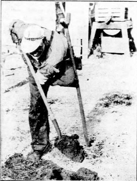
Az emberi erőfelfejtés csodája.

A Népszövetség a romániai magyar kisebbségek petícióját, melyet a székely egyedek utódainak tulajdonában lévő földek kisajátítása ellen adtak be, valamelyik későbbi ülészaka elhalasztotta.