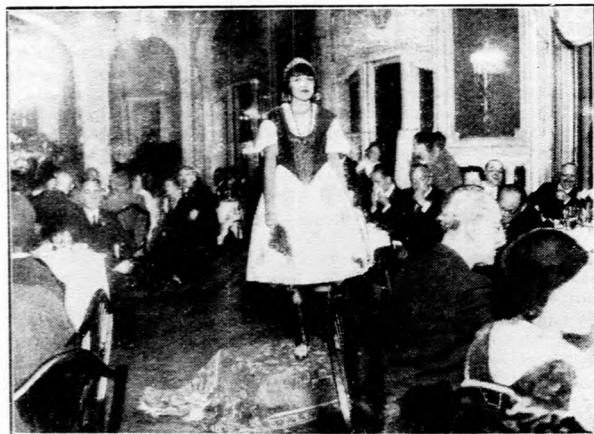
Magyar táncok a külföldiek előtt.

Tárgyalta továbbá a szakosztály a mezőgazdasági munkások utazási kedvezményének kérdését és úgy határozott, hogy a MÁV vonalaira adott kedvezményt a magánvasutakra is kéri fogja. Behatóan megvitatták a gazdasági eselédek teljesítésének kérdését. A nagyarányú vidéki munkanélküliség enyhítésére a munkásokoztály közmunkák sürgős megindítását kívánja. Az Országos Mezőgazdasági Kamara máris adatgyűjtést végzett annak a megállapítására, hogy hol volna leginkább szükséges ezeknek a munkálatoknak megindítása.