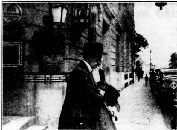
Alfonz spanyol király, Budapesten, a Ritz-szálló előtt.

nak, amelyek aránylagos vagyonosságuk miatt bizonyosfokú adóemelési elbírnak.