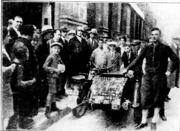
Két délamerikai magyar világkörüli utazása.

A felsődunántúli kerületi műtrágya szakértekezlet augusztus utolsó napján folyt le Győrött a városháza nagyertermében a Felsődunántúli Mezőgazdasági Kamara rendezésében. A szakértekezlet, az ipari, gazdasági és kereskedelmi érdekeltségek egyhangú állásfoglalása után kérte a műtrágyaakciónak a régi keretekben való folytatását, úgy hogy a műtrágya által biztosított többlettermés gabonában kötéssék le a műtrágya kiegészítésére, amely boletttal is legyen törleszhető. A műtrágyaváltók 6 hónapos időtartamát, a műtrágyaváltó illeték eltörlését, inséges körzetekre műtrágyafuvar elengedését, a nem inséges vidékekre a műtrágyafuvar és kövezetvám jelentős mérséklését, a zsákok vámjának, a műtrágyahitel kamatmargójának és a forgalmi adónak csökkentését kérte a győri gyűlés, mert a műtrágyázás által előidézett többlettermés sokezer vagonnal fokozza a vasuti fuvar, az árukereskedelem, az adás-vétel, a fogyasztás, a vásárlóerő emelkedését s így közvetített formában térül meg az államnak és a köznek a könnyítések ellenértéke. A műtrágyahitel ne 11 hónapra, hanem 12, illetve 14 hónapra lenne kiterjesztendő, hogy a közvetlen cséplés utáni lejárat ne kényszerítse a gazdákat tulkiadatra és ez által az árak leron-