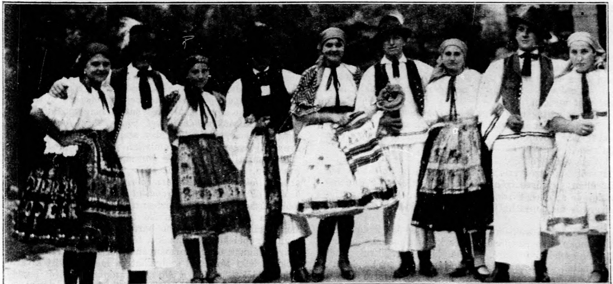
Ösényi menyecskek és férfiak csoportja.

Ki-ki a maga módja és rangja szerint áldozzon. Ugy, mint a 48-as időkben, amikor vetélkedve ajánlották fel a nemzet fiai mindenüket a haza függetlenségéért. E leszegényedett és önhibáján kívül gazdasági válságba került