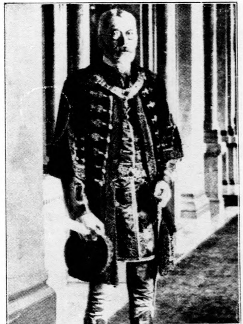
Károlyi Gyula gróf, az új miniszterelnök.

— Politikai irányok és rendszerek nincsenek és