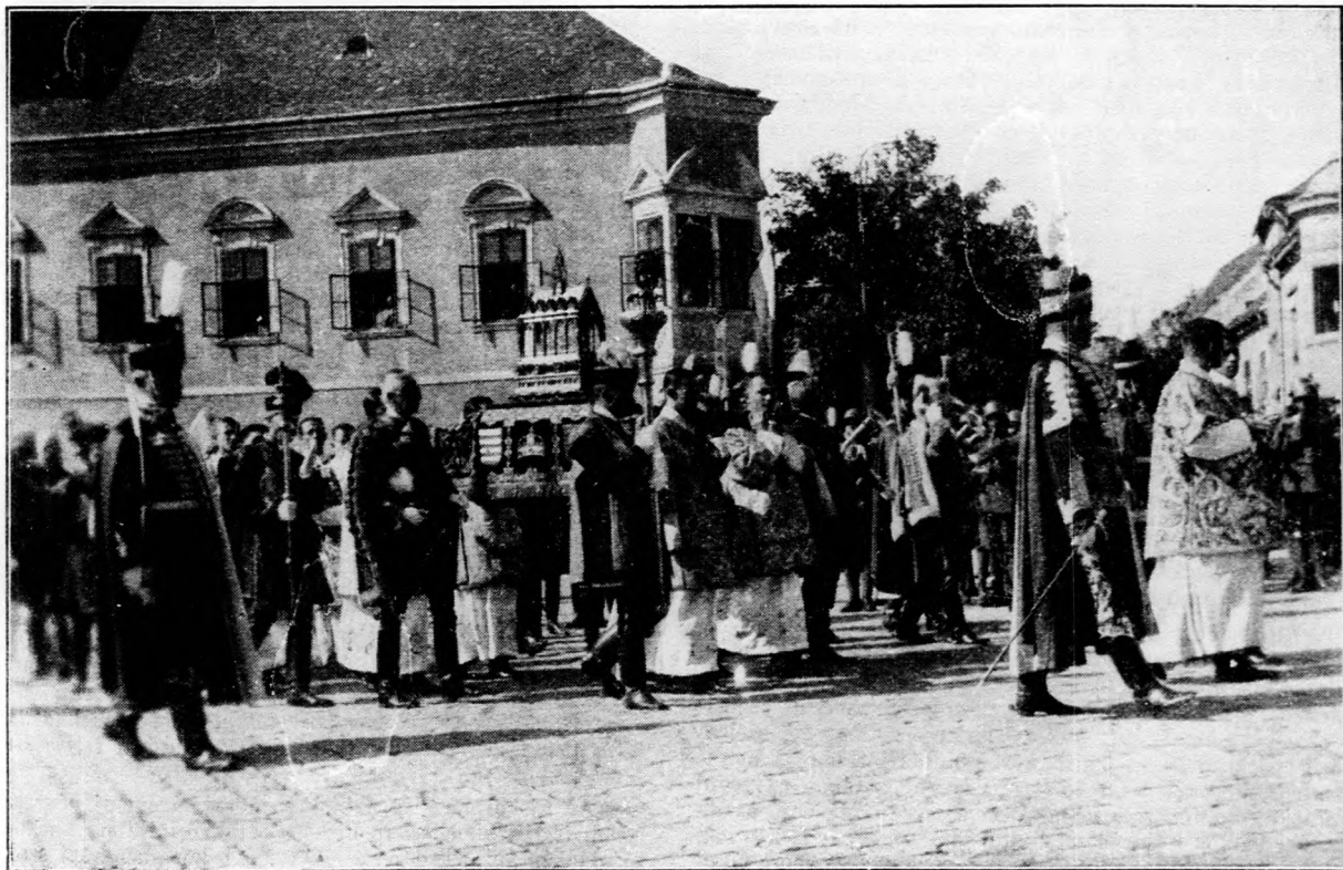
A Szent Jobb a Szent István-napi körmeneten.

A Bethlen-kormány lemondása teljesen váratlanul, a visszavonulás szándékát sejtető előjelek nélkül következett be. A választások után felbukkantak ugyan hírek arról, hogy Bethlen István gróf a Kormányzó Urnak be fogja nyújtani a kormány lemondását avégett, hogy kabinetjét új erővel felfrissítse, ezek a híresztelések azonban egyrészt a jámbor óhajtasok, másrészt a következtetések