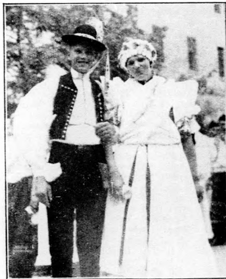
Lakodalmas pár Boldog községből, a Szent István-napi ünnepeken.

— Nem futamodott meg a kormány a maga feladata elől. Nem hagyta cserben az országot és a pártját. Emlékeztetek arra, hogy azt a rövidlejáratu kölcsönt, melyet megszerezünk, mindenesetre odaszámíthatom, mint előkészítő munkánk egyik főmozzanatát . És feloldottuk a hitelélet korlátait anélkül, hogy káros jelenségek mutatkoztak volna. A vágányokat lefektettük és ennek a kormánynak a feladata és kötelessége, hogy a végrehajtás munkáját vállalja ezzel a párttal és a testvérpárttal együtt és kizárólag ezekkel a pártokkal, mert ezek a pártok biztosítják a jogfolytonosságot, az elvek folytonosságát és az irányynak a folytonosságát, amelyet tíz éven keresztül itt képviseltem.