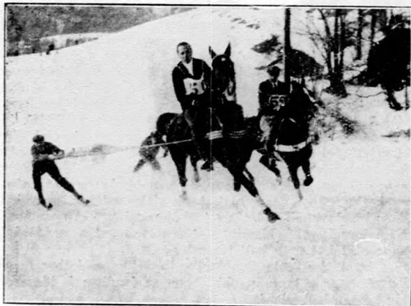
Lovas-siverseny, mely a legvakmerőbb sportok egyike.