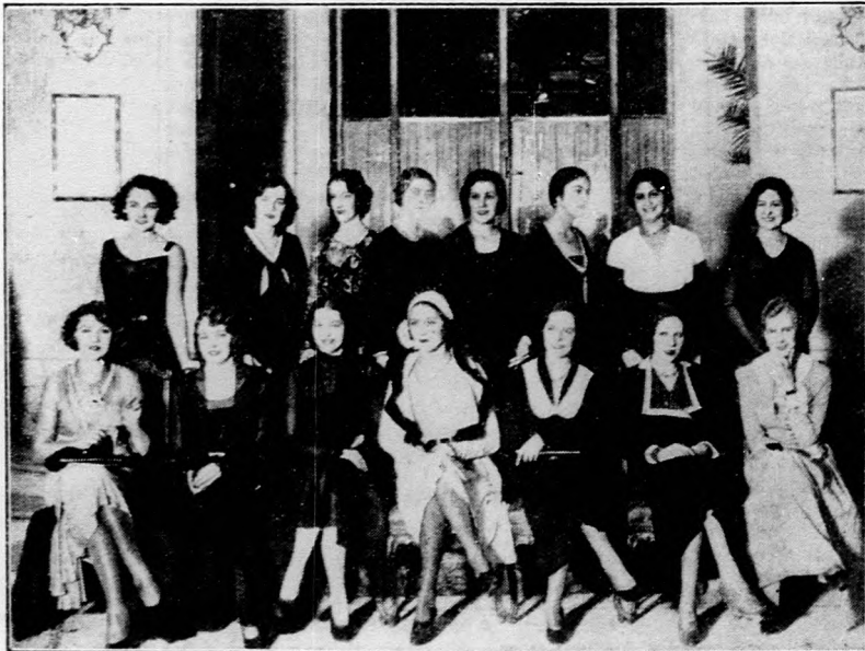
A nemzetközi szépségverseny résztvevői Párisban.