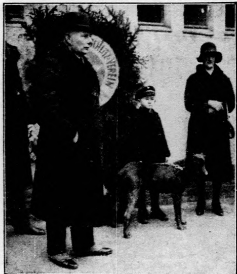
Egy négylábu életmentő kiténtetése.

Ugy éreztük, hogy nagyon, de nagyon igaza volt!