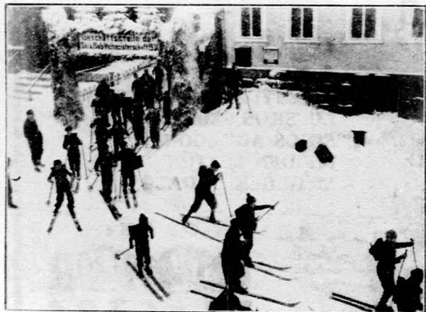
Sitalpon az iskolába.

A német hegyvidék községeiben a gyermekek sitalpon mennek az iskolába.