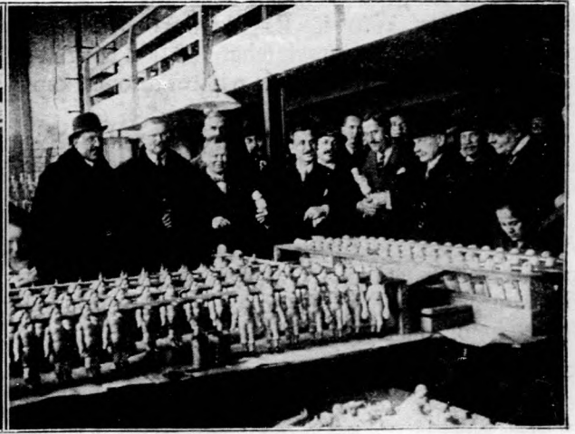
Képviselők látogatása a Magyar Ruggyantaárú-gyárban.

Balról: A ruggyanta hengerelése. — Jobbról: Gummibabák készítése.