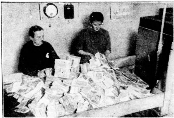
A német papírpénz vége.

Az állati eredetű élelmiszerek közül sok B jelzésű vitamint találunk a tojásban. Ezután következnek a máj, a vesék, az agyvelő, a szív. A közönséges hús keveset tartalmaz. Még kevesebbet a halhús. A tejben található, de nem bőséges mennyiségben.