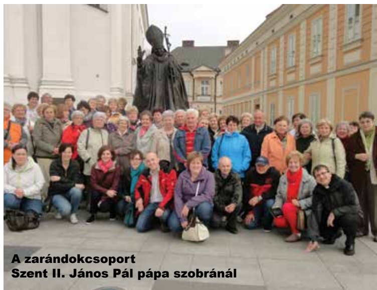
A zarándokcsoport Szent II. János Pál pápa szobránál