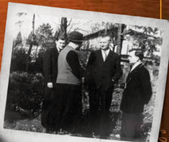
A generális a Kassai utcai ház kertjében