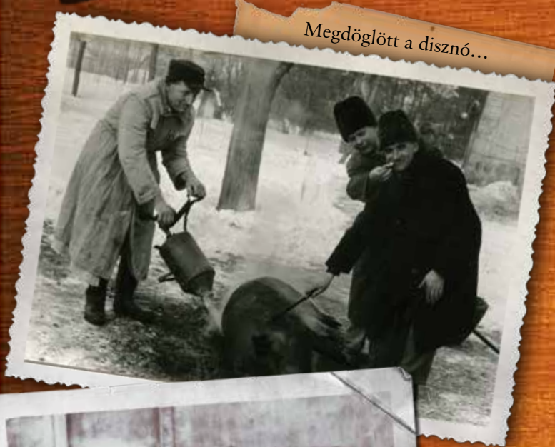
Megdöglött a disznó...