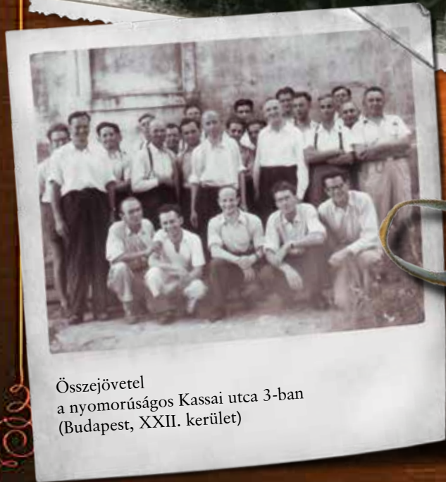
Összejövetel a nyomorúságos Kassai utca 3-ban (Budapest, XXII. kerület)