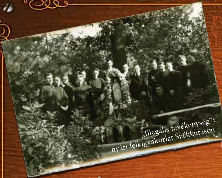
„Illegális tevékenység”: nyári lelkigyakorlat Székkutason