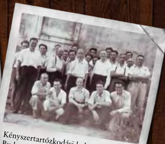
Kényszertartózkodási hely: Budapest, XXII. kerület, Kassai utca