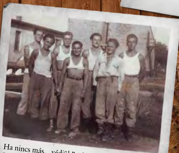
Ha nincs más, „védjük” a hazát. XX. századi rabszolgaság, vagyis munkaszolgálat