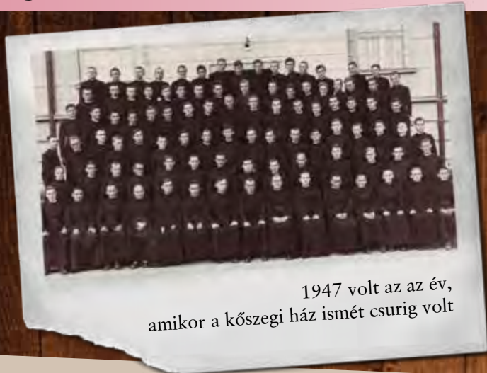
1947 volt az az év, amikor a kőszegi ház ismét csurig volt