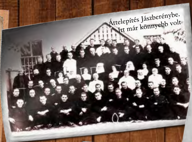
Áttelepítés Jászberénybe. Itt már könnyebb volt