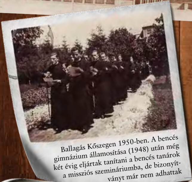
Ballagás Kőszegen 1950-ben. A bencés gimnázium államosítása (1948) után még két évig eljártak tanítani a bencés tanárok a missziós szemináriumba, de bizonyít- ványt már nem adhattak

Az Isteni Ige Társasága 2016-ban ünnepli a rend magyarországi letelepedé- sének századik évfordulóját. A centenáriumba készülve há- lát adunk Istennek a kapott kegyelmekért, és tisztelettel gondolunk azokra a verbita szerzetesekre, akik az elmúlt száz évben odaadóan szolgál- tak a magyarországi, illetve a világmisszióban. Soroza- tunkban fényképekkel idéz- zük fel az elmúlt évszázad fontos állomásait, pillanatait.