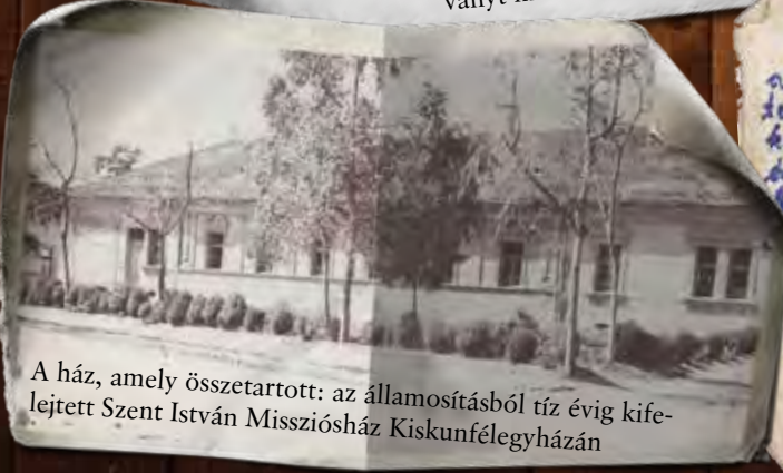
A ház, amely összetartott: az államosításból tíz évig kife- lejtett Szent István Misszióház Kiskunfélegyházán