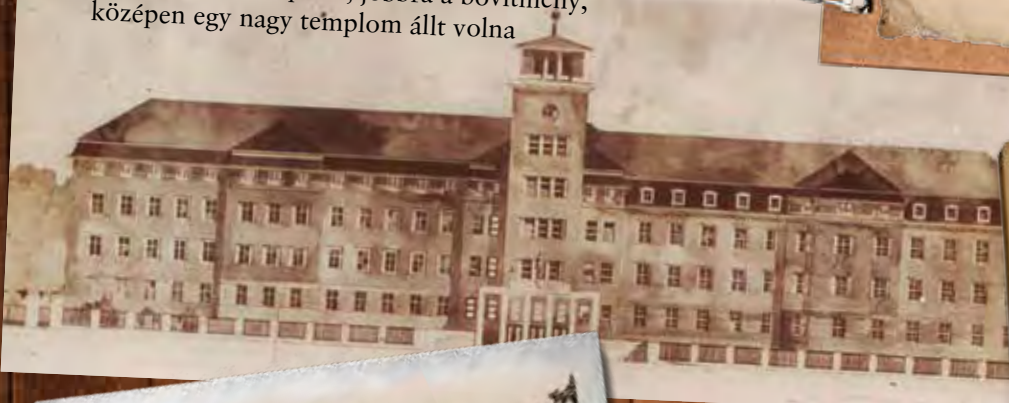
Elképzelés a kőszegi ház kibővítéséről 1948-ból. Balra az eredeti épület, jobbra a bővítmény, középen egy nagy templom állt volna

Az Isteni Ige Társasága 2016-ban ünnepli a rend magyarországi letelepedé- sének századik évfordulóját. A centenáriumba készülve há- lát adunk Istennek a kapott kegyelmekért, és tisztelettel gondolunk azokra a verbita szerzetesekre, akik az elmúlt száz évben odaadóan szolgál- tak a magyarországi, illetve a világmisszióban. Soroza- tunkban fényképekkel idéz- zük fel az elmúlt évszázad fontos állomásait, pillanatait.