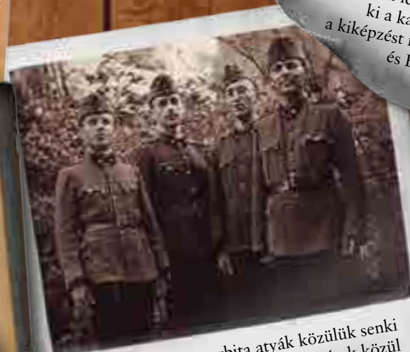
Hála Istennek a verbita atyák közülük senki sem került a frontra. A testvérek közül azonban többen is, és ketten elestek a háborúban