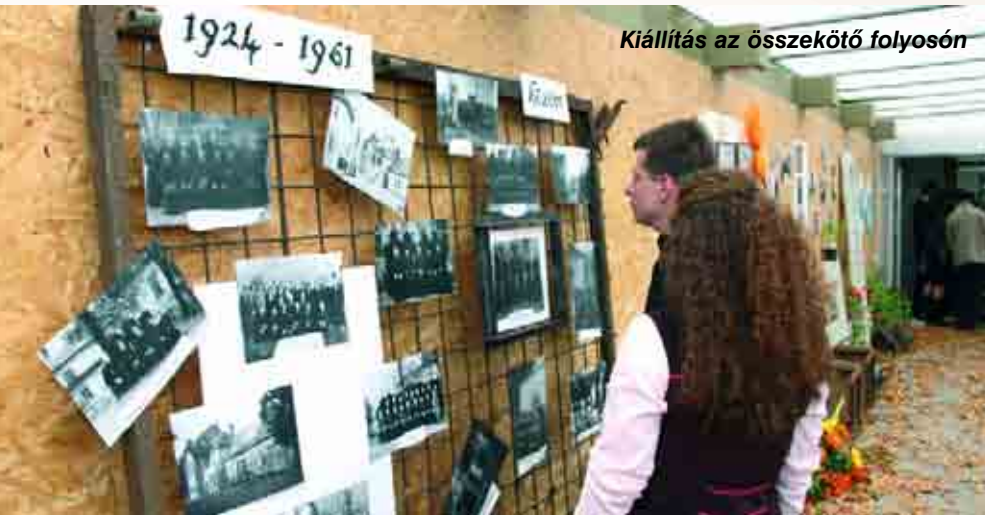
Kiállítás az összekötő folyosón