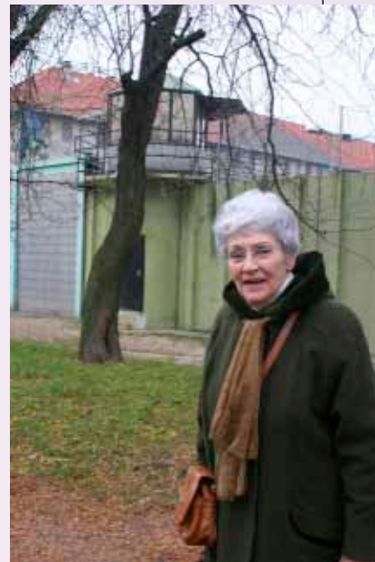
A kőbányai börtön előtt