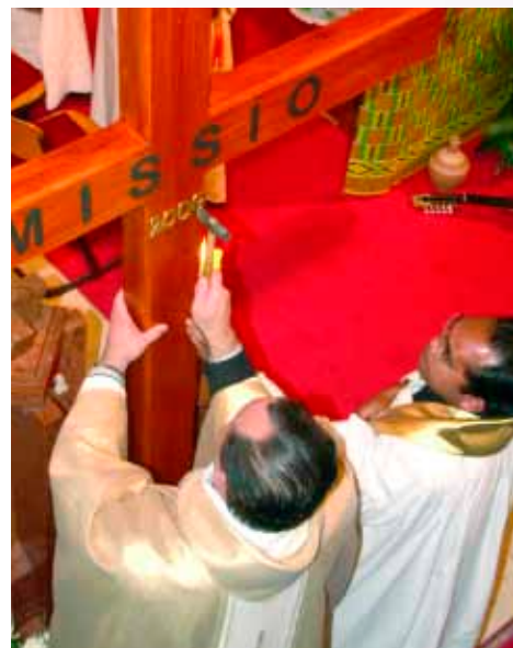
A 2009-es évszám elhelyezése a missziós napok végén Hajóson