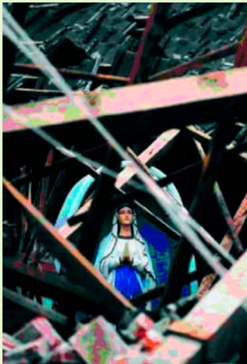
Mária szobor a padangi székesegyházban

A két példa érzékelteti, mennyire ragaszkodnak Szűz Máriához az indonéz hívek. Igen nagy lommal fordulhatunk hozzá. Ez a nitai és a padangi Mária-szobrok üzenete.