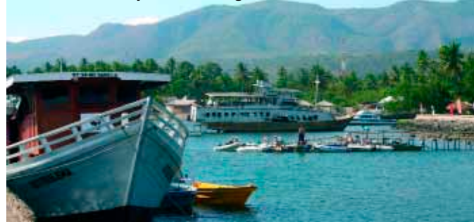
Larantuka kikötője Flores szigetén – Indonézia

Jézus hívására a tanítványok válasza nagyon egyszerű volt: hallgattak a megszólítására, engedelmessé váltak és teljesen ráhagyatkoztak a Mesterre. Azonnal ott hagyták hálójukat, hajójukat és követték őt.