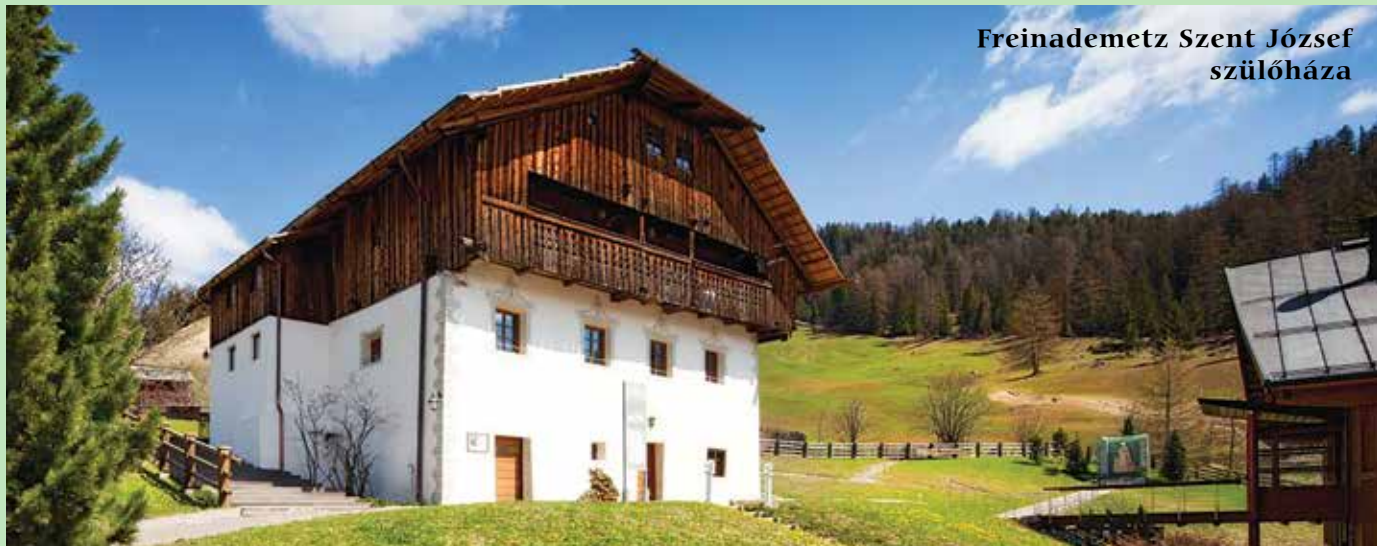
Freinademetz Szent József szülőháza