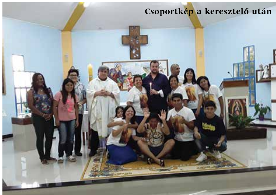
Csoportkép a keresztelő után

Pont akkor érkezett, amikor a szokásos éves lelkigyakorlatot tartottam a plébánián, amiben mindig nagy segítségemre van egy argentin missziós közösség, a Roca Viva (Élő Szikla), akik az Andokban laknak, de minden évben legalább két hetet itt vannak a plébá-