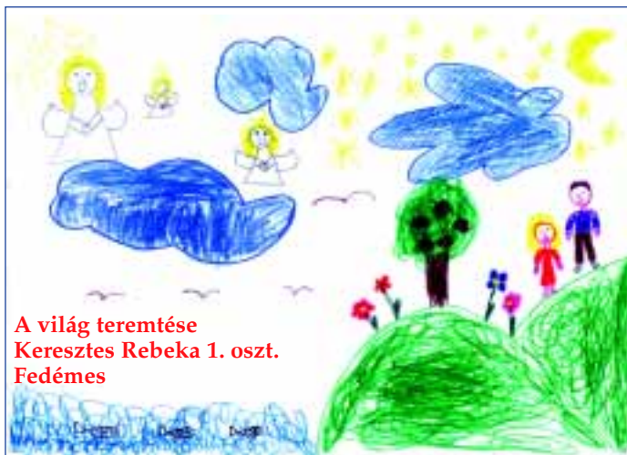
A világ teremtése Keresztes Rebeka 1. oszt. Fedémes