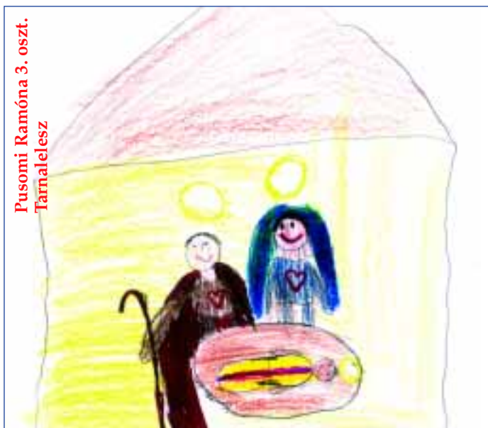
Pusomi Ramóna 3. oszt. Tárnalelesz