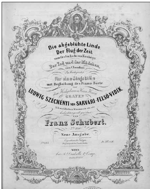
Franz Schubert dalai Széchenyi Lajos verseire és a neki ajánlott dal: A halál és a lányka – címlap

követ lett, ahol a birodalom részéről ő írta alá a Három császár szövetségét, amely hosszú időre meghatározta az európai egyensúlyt. A Kongó-konferenciát lezáró berlini egyezményt is ő szignálta. Bismarck (a „Vasancellár”) barátja volt. II. Vilmos császár 1893. szeptember 10-én meglátogatta Imrét családi birtokán, Horpácson. Szenvedélye a zene volt, kitűnően zongorázott és sokat komponált. A látogatás szerint magát műkedvelő zeneszerzőnek értékelte, és nem törekedett művei kinyomtatására, így éppen azok a darabjai veszttek el, amelyek zeneszerzői szempontból a legérdekesebbek lennének számunkra, például két vonósnégyese. Széchenyi Kálmán összeállította a műjegyzéket, amelyben már több mint száz darab