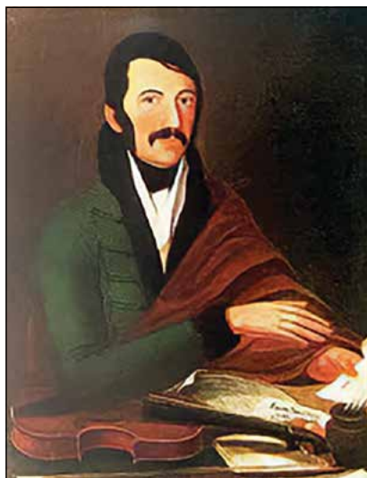
Lavotta János (ismeretlen festő alkotása)

A verbunkoszerző, hegedűvirtuóz, színházi karmester, háztanító Lavotta János a halotti anyakönyvi bejegyzés szerint 1820. augusztus 11-én – a Bécsben megjelenő Magyar Kurír tudósítása szerint 10-én – 56 éves korában, Tállyán hunyt el. Síremlékének déli oldalán a gúla alatti négyszög-talpalzaton olvasható: Itt nyugszik a maga idejének Orfeussa (sic). 2020-ban Lavotta János halálának bicentenáriuma emlékezik a magyar zenei élet, valamint a nevét viselő alapítvány, kamarazenekar és művészeti iskola Sátoraljaújhelyen.