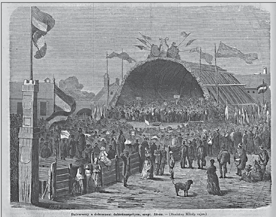
Dalverseny a debreceni dalversenypályán, szept. 20-án. — (Munkácsy Mihály rajza.)

„Lapunk Munkácsy Mihály sikerült rajza után az ünnepély legfontosabb mozzanatát, a tulajdonképeni dalversenyt mutatja be közönségünknek. A dalszarnok, melyet képzünk előtűntet, a czeglédutcza végén eső nagy térségen foglalt helyet [...]. Hatvan dalárda mintegy 850 taggal gyűlt össze e napon (szept. 20.) a városház előtti téren, hogy a megállapított rendben sorakozva vonuljon el a dalszarnok helyiségéhez. A város ünnepi színt öltött s az arczokon öröm ragyogott. Lélekemelő látvány volt végig tekinteni ez ünnepélyes meneten, melynek hátterét és körzetét a vasárnapi díszben fel s alá hullámozó roppant néptömeg képezte. [...] A dalszarnokhoz érve az egyes egyletek zászlóikat két oldalt sorba állíták, s a dalárok szép rendben léptek fel a dalszarnok padjaira, hogy ott négy hang szerint osztályozva foglalják el helyeiket. – A dalversenyt rézhangszerek kísérete mellett Erkel hymnusa nyitotta meg. Az ősz maestrót szünni nem akaró éljen fogadta, mely a hymnus végével még viharosabban ismétlődött. Ezután az egyes dalárdák verseny-előadásai következtek. [...] Az összelőadások közül nagy hatása volt a »Harczos imájá«-nak és Mosonyi ez alkalomra irt művének, a »Szentelt hantok«-nak. A dalversenyt Vörösmarty »Szózata« rekesztette be, énekelve az összes dalegyletek, sőt a közönség nagy része által is. E pillanat feledhetlenül bevésődött a jelenvoltak emlékébe, s méltó arra, hogy megörökíttessék. Képünk e mozzanatot tünteti föl.” (Vasárnapi Újság, 1868. október 4.)