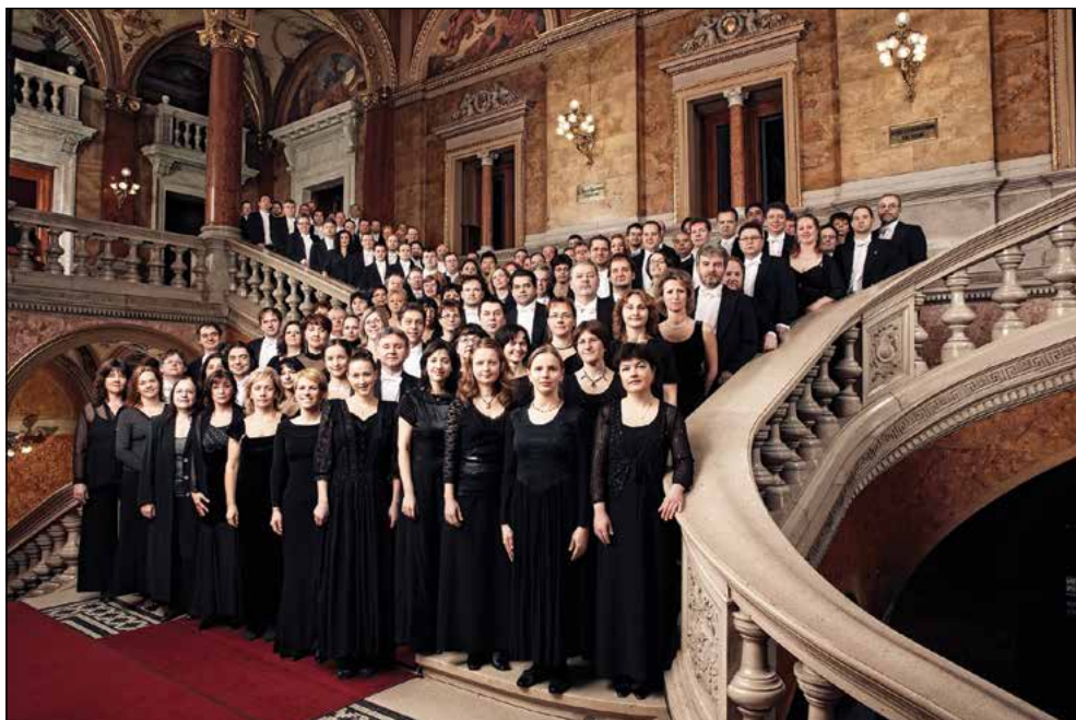
A Filharmoniai Társaság Zenekara napjainkban

Ennek jegyében az elmúlt években sokkal nagyobb hangsúlyt fektettünk kamarazenei koncertek szervezésére. Tagságunk részéről egyértelmű jelzés volt, hogy szeretnének minél többet kisebb formációkban is muzsikálni. Ezért az Óbudai Társaskörben és a martonvásári Brunsvik-kastélyban is sorozatokat indítottunk. Minden koncertünkön zenetörténészek mesélnek az adott művekről, ennek segítségével bepillantást nyerhetünk a zeneirodalom kulisszái mögé.