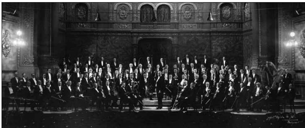
A Filharmoniai Társaság Zenekara 1943-ban Dohnányi Ernővel az élen

Az első filharmoniai hangverseny (1853. november 20.) műsorlapja. A zenekart Erkel Ferenc vezényelte, helyszíne a Nemzeti Múzeum terme volt