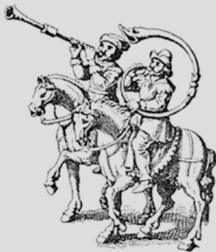
Két lovas zenész: körtrombitás német és kucsmás magyar huszár tárogatóval (rézmetszet, 1689)

„Legnemzetibb hangszerünk a tárogató. Korhadt öblében évszázados keservek, rég lezajlott csaták emlékei, rég porladó hősök harci kiáltásai szunnyadnak. [...] a nemzeti lélek [...] évszázadokon át a tárogató hangjain keresztül ontotta felénk minden bánatát és örömét. Ezért a legmagyarabb hangszer a tárogató.” (Haraszt Emil, 1918)