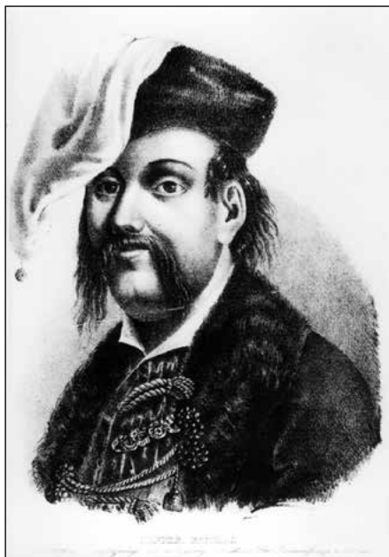
Bekes Gáspár utólagos portréja (1841)