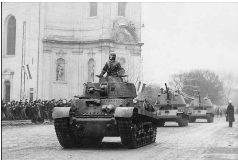
Az 1./II. harckocsi zászlóalj egyik 40 M. Turán közepes harckocsija, mögötte két 40 M. Nimród páncélvadász és légvédelmi gépágyú. Jászberény, 1943. december 6.

Adassék tisztelet a honvédő katonáknak, Testük eleven torlasztát állították gátnak, A ránk zúduló vörös áradat ellenében Állták Tordánál a csatát fejtetőig vérben, És nem haltak meg, válságos órán előjönnek, Mert utóvédként előőrsei a jövődönnek.