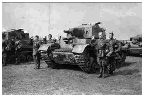
A 3./III. harckocsi zászlóalj egyik 41 M. Turán nehéz harckocsija és esküt tevő kezelősze-mélyzete. Kiskunhalas, 1944. március 15.