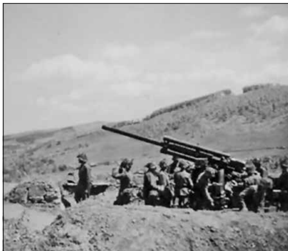
A kolozsvári 105. légvédelmi tüzérsztály egyik 29 M. 8 cm-es légvédelmi ágyúja tüzelőállásban a Kárpátok előterében, 1944 nyarán