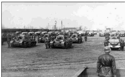
A 3./III. harckocsi zászlóalj szemléje a kiskunhalasi vasútállomás mellett, 1944. március 15-én