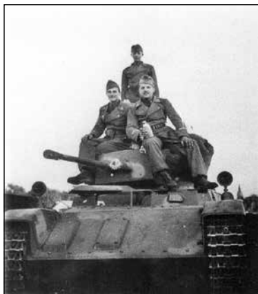
4 cm-es harckocsi ágyúval felszerelt „foltozott” 38 M. Toldi könnyűharckocsi és személyzete. Jászberény, 1944.