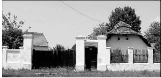
Hagyományos falusias ház

Megjegyezzük, hogy erre az összefüggésre korábban és más megfogalmazásban már Hajnal István történész fölhívta a figyelmet, amikor így írt: „a település a legtisztább formaképződés, ahol a társadalom minden folyamata valamiképpen lerakódik” (idézi TAMÁSKA 2006).