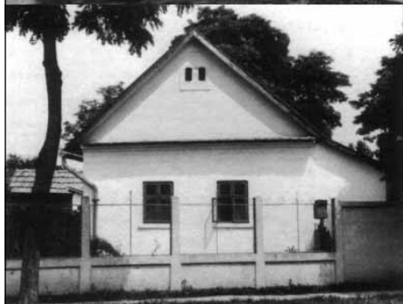
II. építési periódus