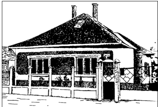
Új építésű, úgynevezett kockaház/sátortetős ház