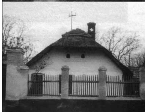
Ia. építési periódus

kú alaprajzú), 4 vagy több helyiséges lakóház. A falsíkok színezése már nem kizárólagosan fehér.