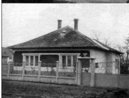
III. építési periódus

Kutatásaink a népi építkezés, a falusi-mezővárosi építészeti gyakorlat körében azt látszanak igazolni, hogy a települések építészeti arculata – optimális körülmények között – több-kevesebb következetességgel mintegy leképezi az ott élők különböző viszonyait.