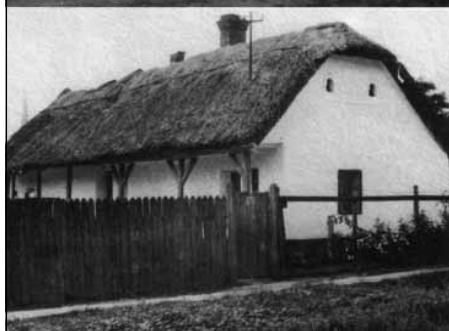
I. építési periódus