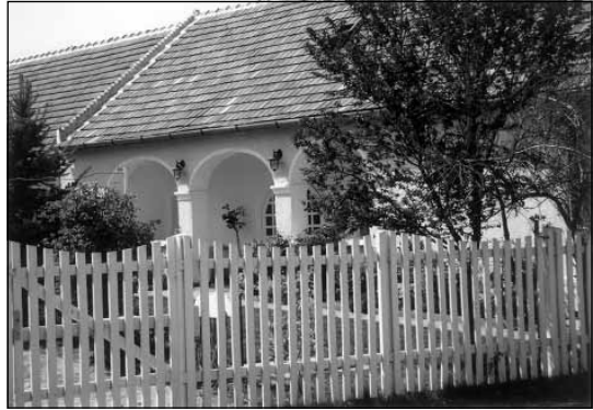
Felújított falusi ház