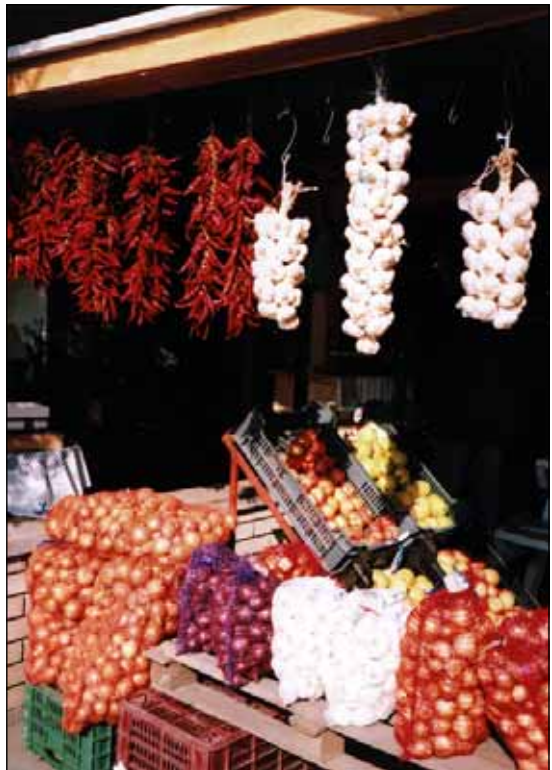
Füzérek, fürtök, vásárlóikra várnak, színes kínálat.