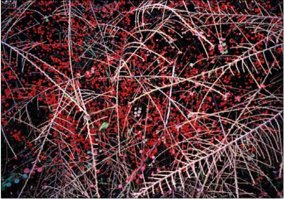
Kopár hálózat bíbor bogyó-fürtökön: őszi grafika.