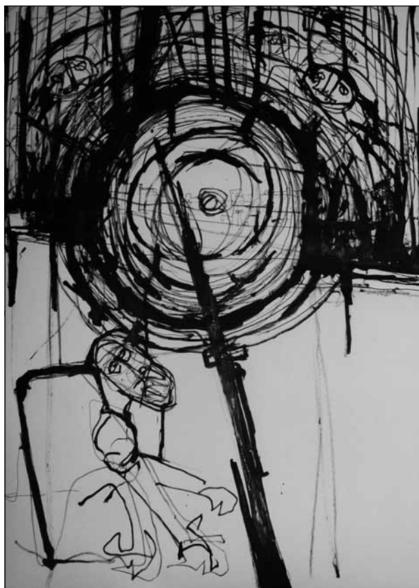
SZABÓ KRISTÓF | A MÁSODIK ELJÖVETEL