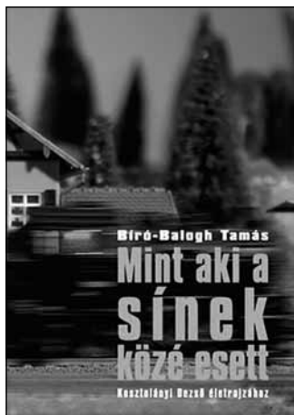
Bíró-Balogh Tamás, Mint aki a sínek közé esett. Kosztolányi Dezső életrajzához , Equinter Kiadó, 2014

E kis tanulmánykötet alapos filológiai kutatás után született cikkek és tanulmányok gyűjteménye. A kutatások során a fiatal irodalomtörténész főleg Kosztolányi életének egy eléggé homályban maradt időszakára, az 1918–1922 közötti évekre koncentrált, különösen a Pardon-rovatban névtelenül és az Új Nemzedékben más rovatokban névvel megjelent cikkekre. (Talán erre utal a Karinthy-féle paródiából vett ironikus cím is.)