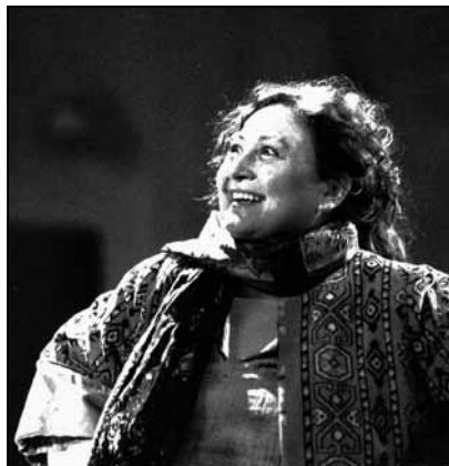
Howard Barker: Jelenetek egy kivégzésből

Mióta tudom, hogy vannak férfiak, nők, akiket színésznek neveznek, mindig az szerettem volna lenni. A felnőttek szemében – akik körülvettek egy kis faluban – ez kivihetetlen álmokképpé vált. Aztán – mit tesz Isten! –, amit az ember belül nagyon elhatároz, az előbb-utóbb kifelé is megmutatkozik – tartja a mondás: az általános iskola és a nem éppen „humán” közgazdasági technikum után első nekifutásra felvettek a Színművészeti Főiskolára, sikeresen elvégeztem immáron negyvenhat éve, és azóta szolgálom Tháliát több-kevesebb, de inkább több, mint kevesebb sikerrel. Azok közé tartozom,