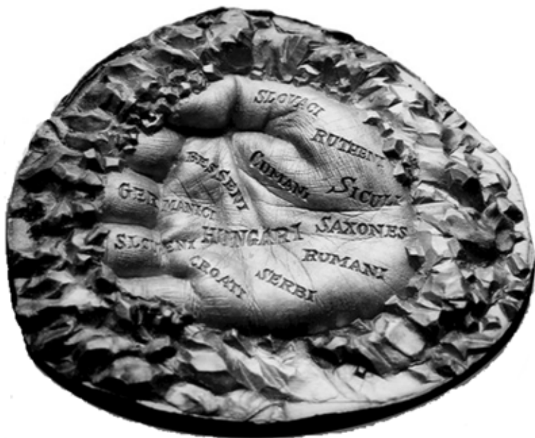
LEBÓ FERENC ISTEN TENYERÉN