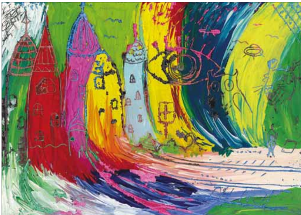
FRICSKA DORKA FESTMÉNYEI