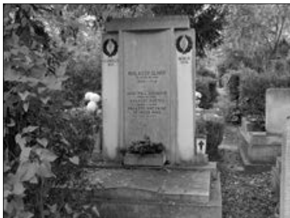
HALASSY OLIVÉR SÍRJA

„Halassy Olivért, a legeredményesebb magyar úszó- és vízipóló bajnokot több ezer főnyi gyászoló közönség kísérte el utolsó útjára a Megyeri temetőben. [...] Temetésén ott volt az UTE teljes gárdája; a többi újpesti sportegyesület és a város társadalmi egyesületeinek vezetői. Halassy Olivért az UTE a maga halottjának tekintette és Újpest város által adományozott dízsírhelyre temették.”