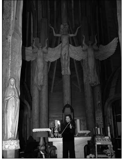
Oltár a Szentlélek-templomban

A jelenleg húszezer fős település 1979-ben kapott városi címet, amiben döntő szerepe volt az atomerőmű felépítésének.