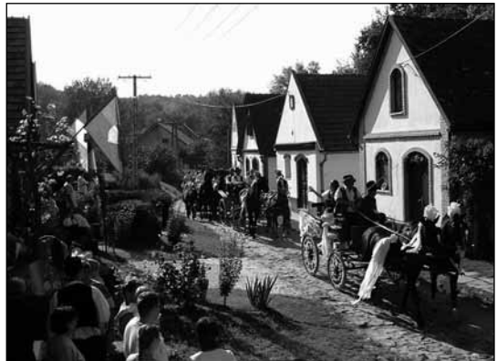
Szüreti felvonulás Dunakömlődön

Az utazó, ha Paksot Szekszárd irányában hagyja el, nem kerülheti el az évente harmincezer embert fogadó Tájékoztató és Látogatóközpontot, az atomerőmű múzeumát és bemutatótermét.