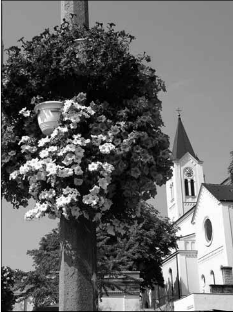
Virágos Paks a Jézus Szíve nagytemplommal