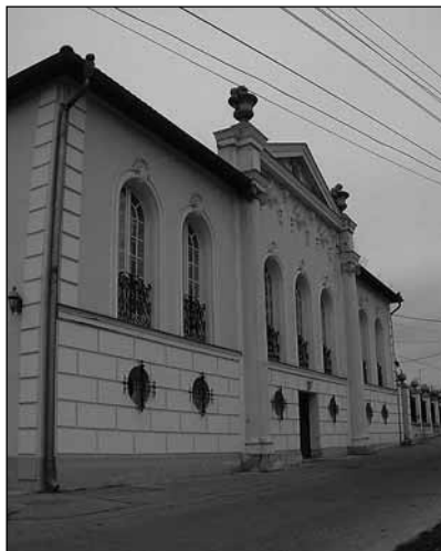
A Prelátus épülete

A két világháború közötti időszak a világgazdasági válság ellenére a gazdasági fejlődés jeleit mutatta.